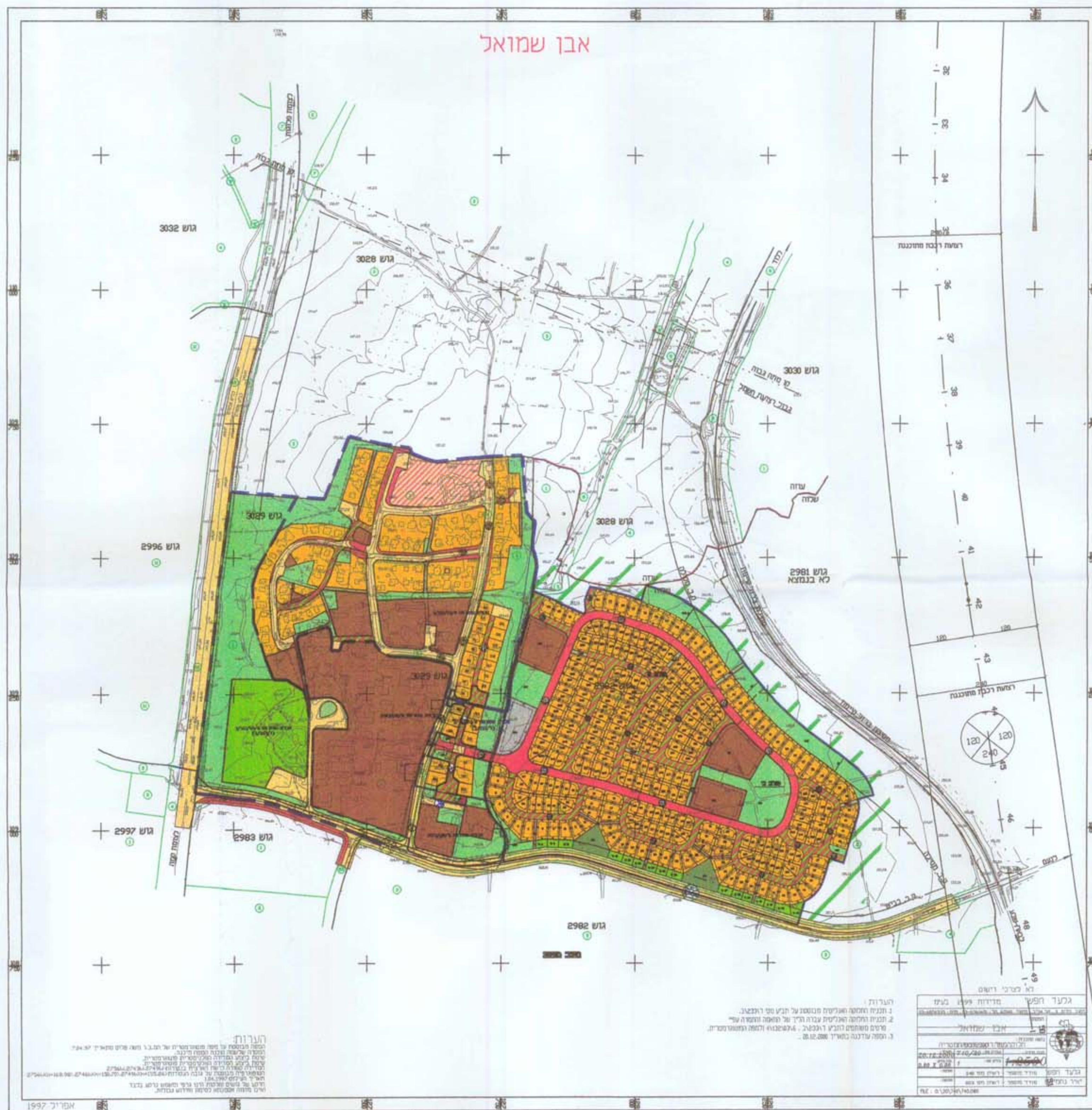
תרשים אינפורמטיבי 1 : 5,000

מיון : 11-02-2003 בעל הקרקע : מינהל מקרקעי ישראל מנועצה : מינהל מקרקעי ישראל תעדה מקומית : 9.6.99 מחנן : ב. איזנברג ב. שרמן