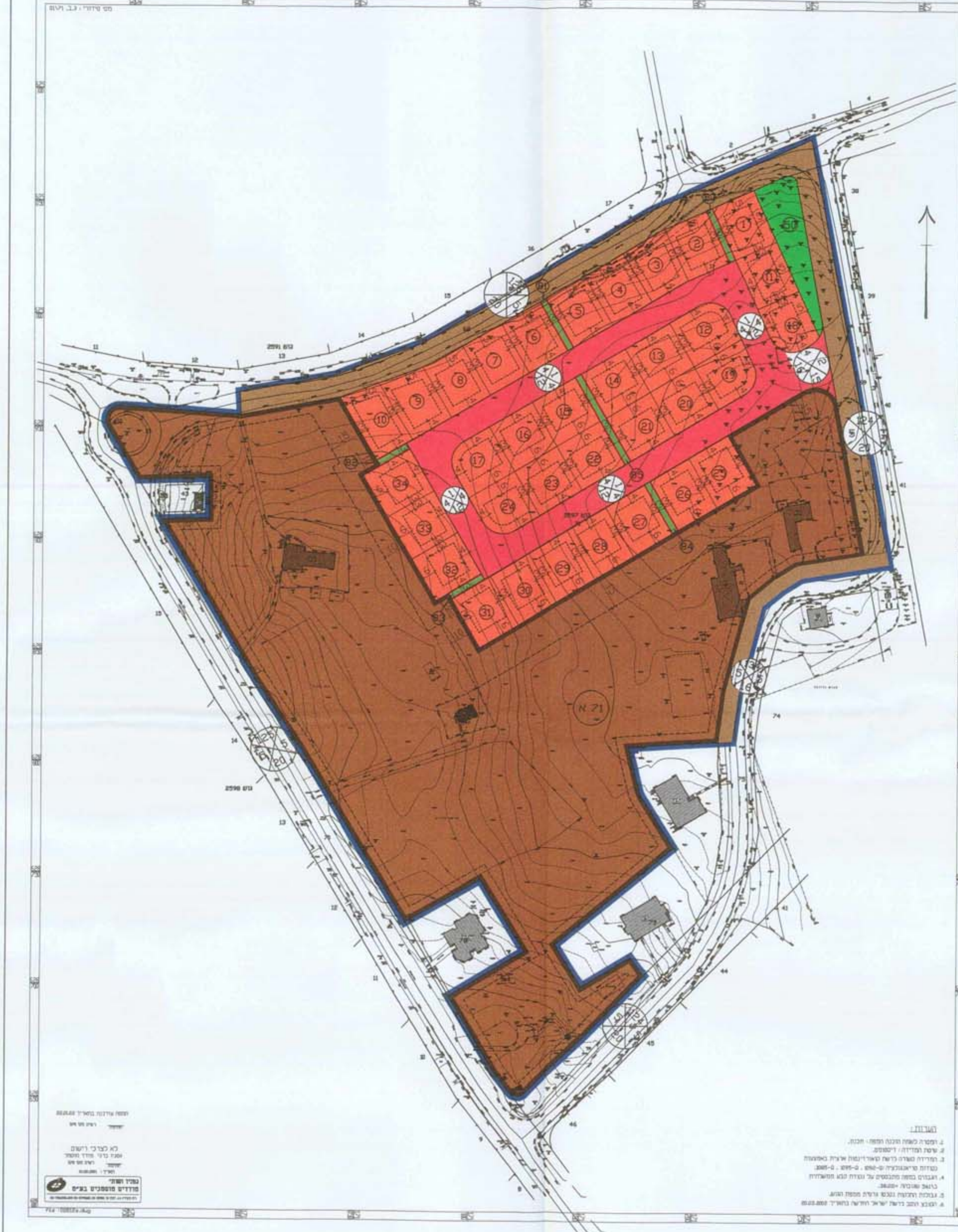
מצב מוצע 1:1250