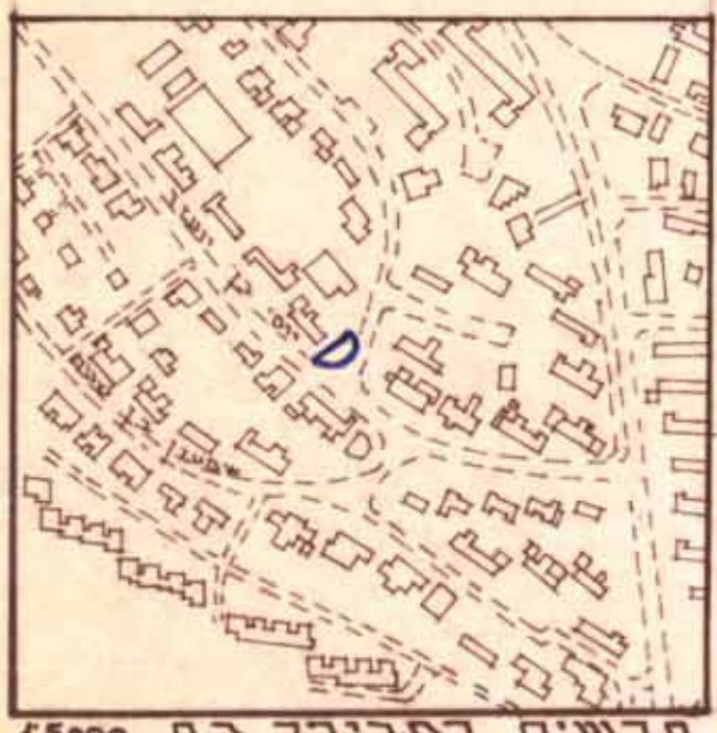
תרשים הסביבה ק.מ. 1:5000