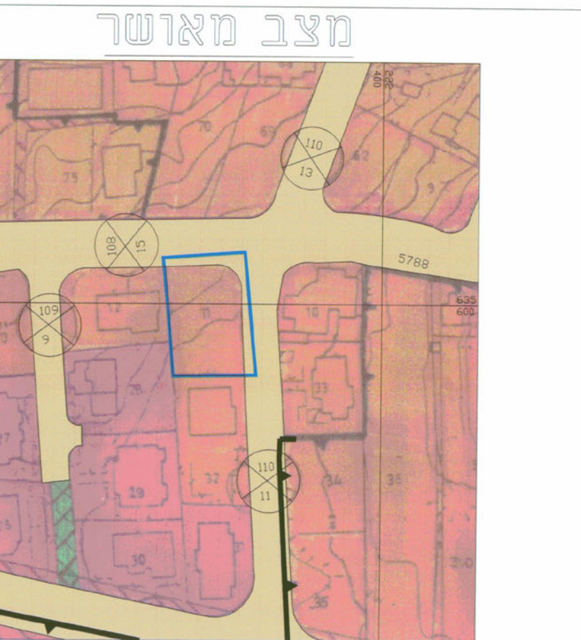
מצב מאושר ע"פ תכנית ב.מ/ 3456 ק.מ. 1:1250

מחוז : ירושלים נפה : ירושלים מקום : שעפאט גוש : 30550 חלקה : 11 שטח : 1.049 הוכן עבור :