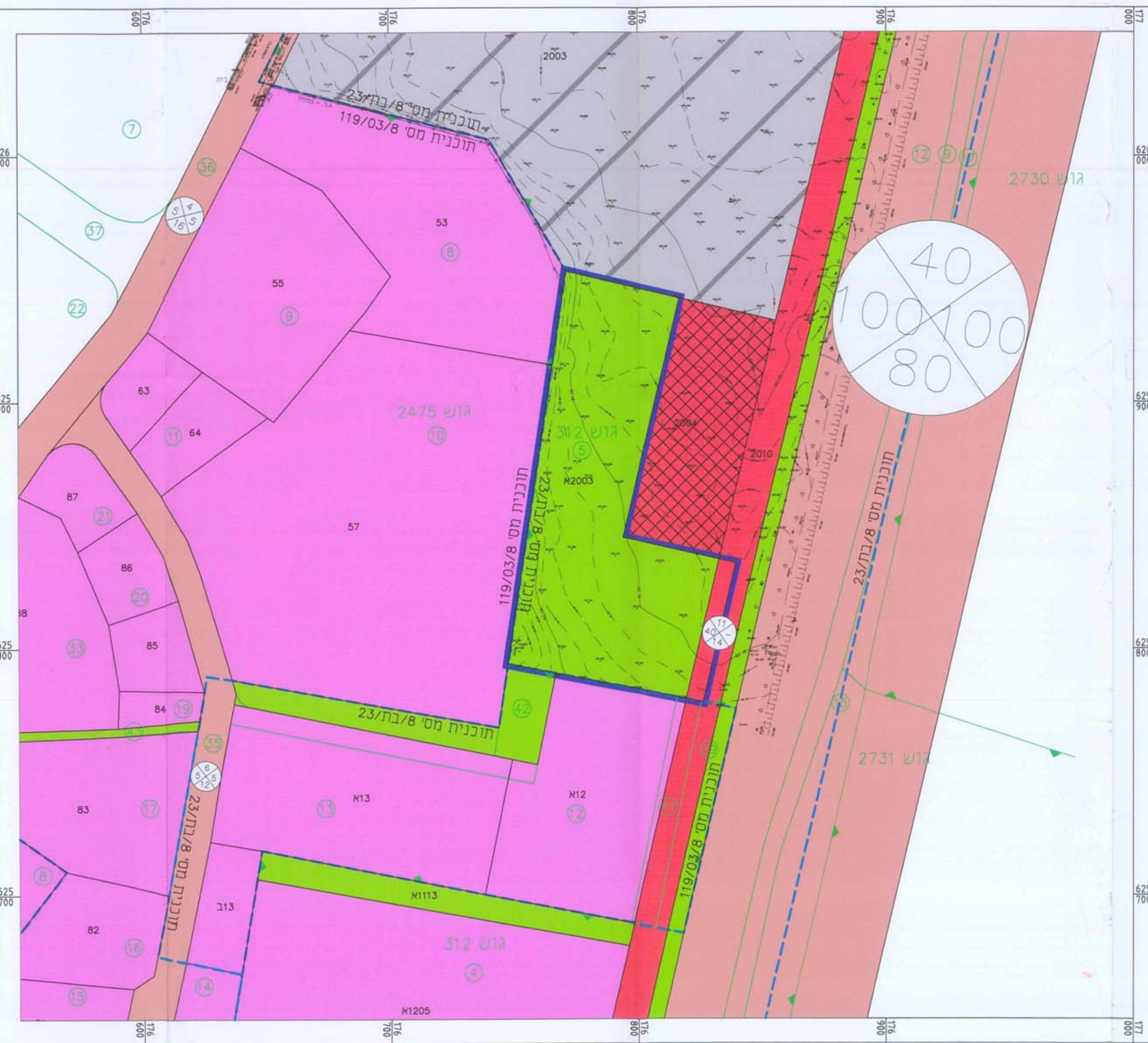
מצב קיים קנ"מ 1:1000