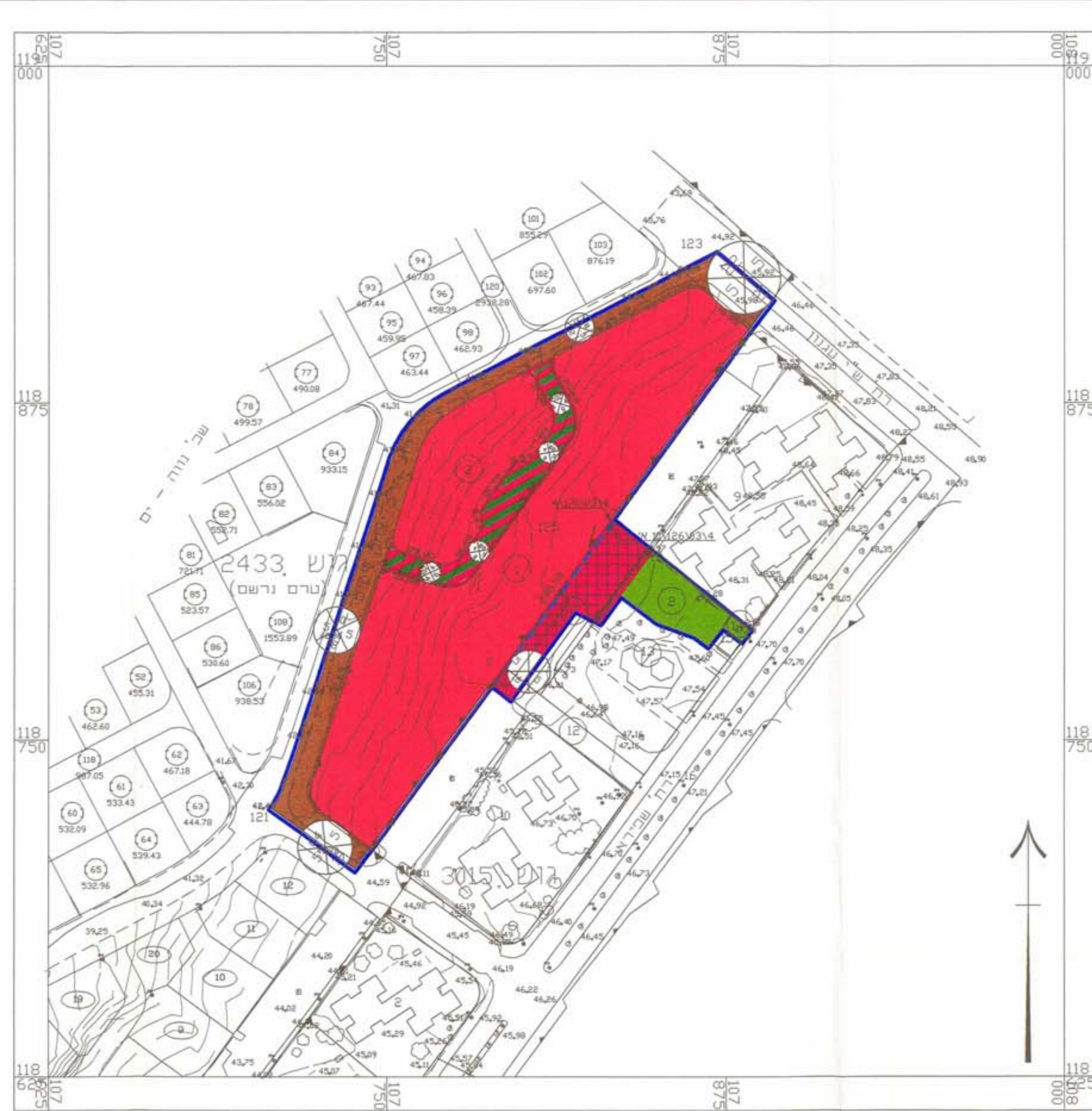
מצב קיים ק.מ. : 1:1250