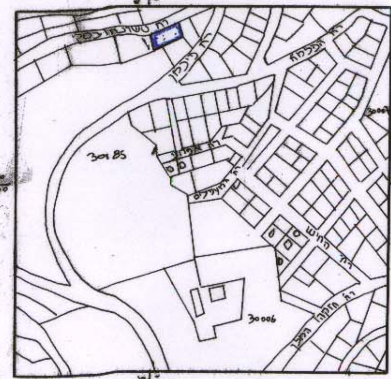
תרשים סקלה ק.ס. 1:5000

מחוז ירושלים מרחב תכנון מקומי ירושלים חכנית מס' 5527 שינוי מס' 97 / לתכנית המתאר המקומית לירושלים שינוי מס' 97 / לתכנית 1165 א' (שינוי מתכנית מתאר מקומית)