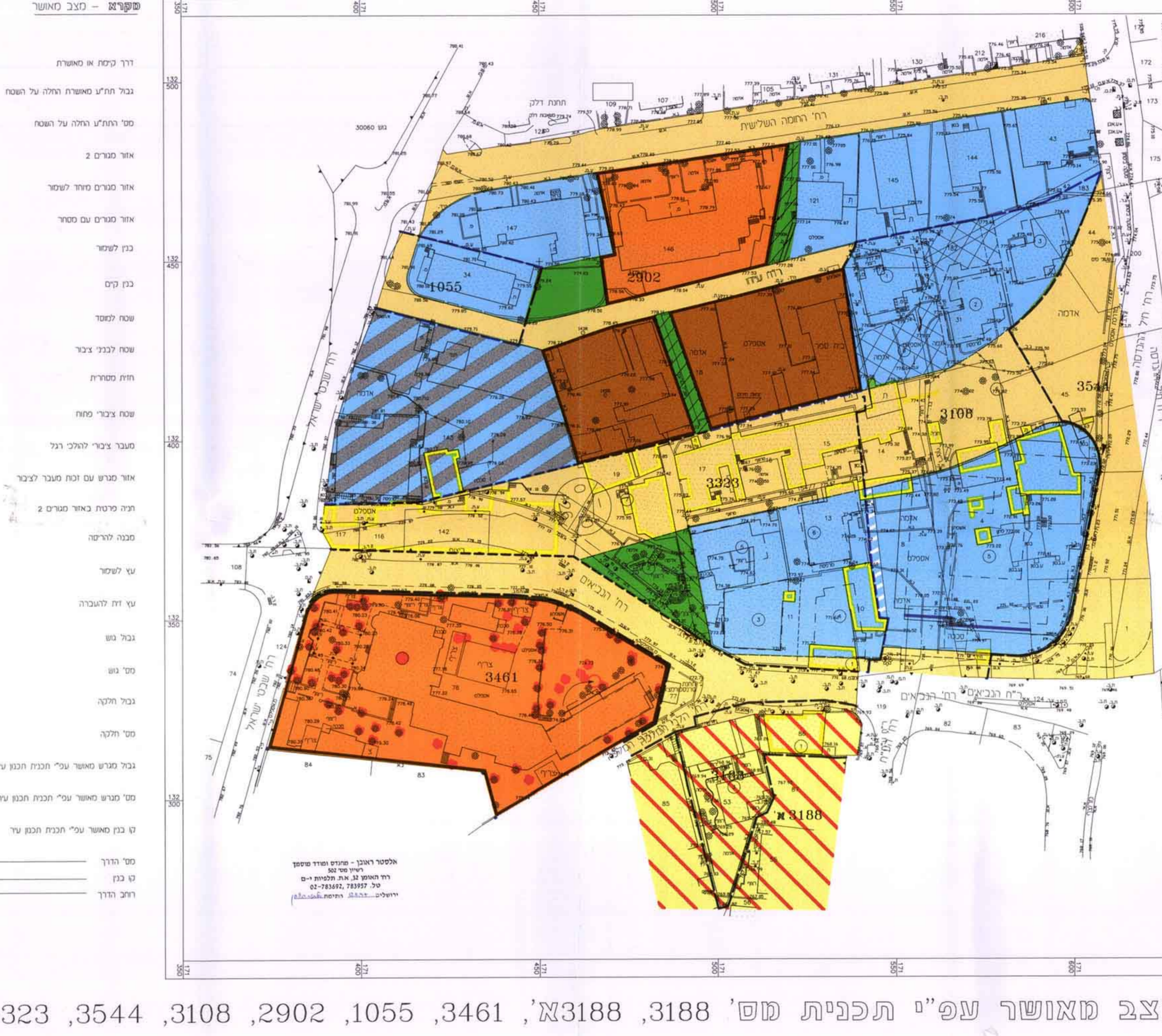
מצב מאושר עפ"י תכנית חש' 3188, 3188A, 3461, 1055, 2902, 3108, 3544, 3323

עריכת תכנון עקומי ירושלים תכנית חש' 4457 שניו חש' 1/92 לתכנית המתאר לירושלים שניו חש' 1/92 לתכנית חש' 3544, 3461, 3323, 3188, 3188A, 3108, 2902, 1055 (שניו תכנית מחזור קומות) תשריטת ק.ג.מ. 1:500 בעל הקרקע: מחלקת עריכת תכנון ירושלים תאריך: 3-10-1997 מגש התכנית: עריכת תכנון ירושלים מאריך: 31-10-1997 המחנן: ע"י עריכת תכנון ירושלים / ציפי כהן אדריכל אוראי: שרון אברמסון רו"ב ובעל רישום ירושלים 9305 / טל 02-644926 תאריך: 17/11/97