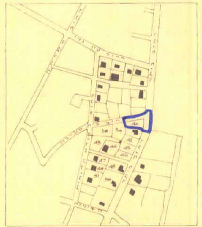
תצוים העגיבה 1:5000