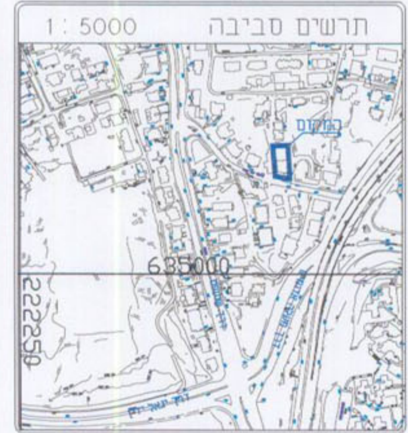
תרשים סביבה 1 : 5000