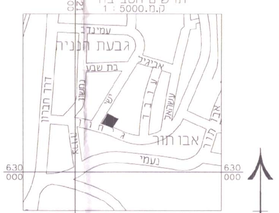
תרשים המקום ק.מ. 1 : 1250

מחוז : ירושלים נפה : ירושלים המקום : אבו טור רח' הגיחון 9 גוש : 30019 חלקה : 109 השטח : 0.572 (ד"מ) הוכן עבור בעלים תרשים הסביבה 1 : 5000.ק.מ.