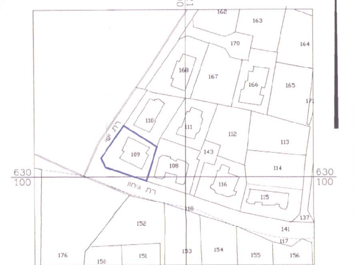
לא לצרכי דישום