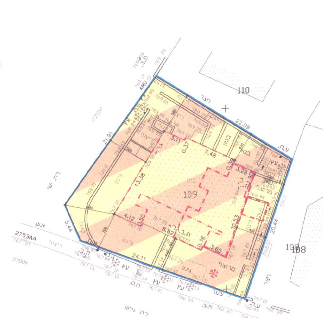
קנה מידה 1 : 250