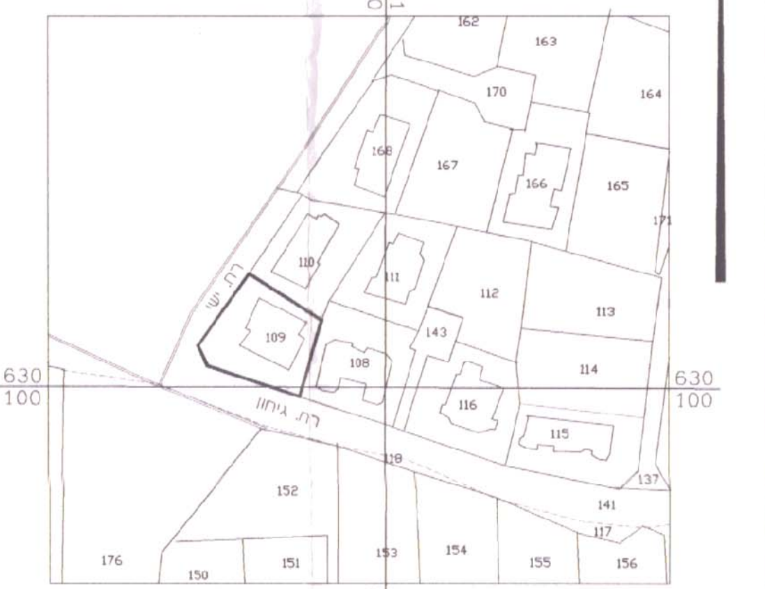
לא לצרכי דישום