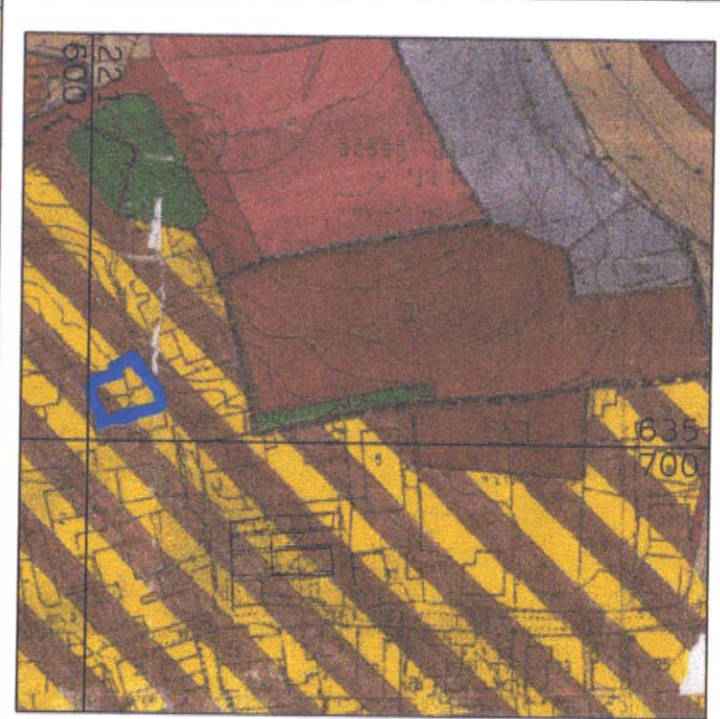
מצב מאושר עפ"י תכנית ב.מ. 3456-תשריט מס' 1- קנה מידה 1-2500