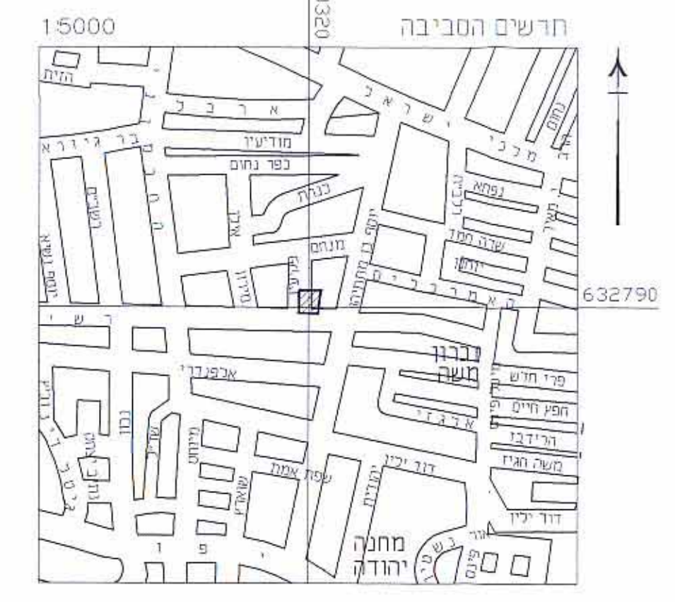
תרשים הסביבה ק.מ. 1:5000

חיה שטרית אדריכלות ותכנון ערים רחוב בילו 19/26 נל-ציונה 74061 טל-08-9407493 פקס-08-9409871