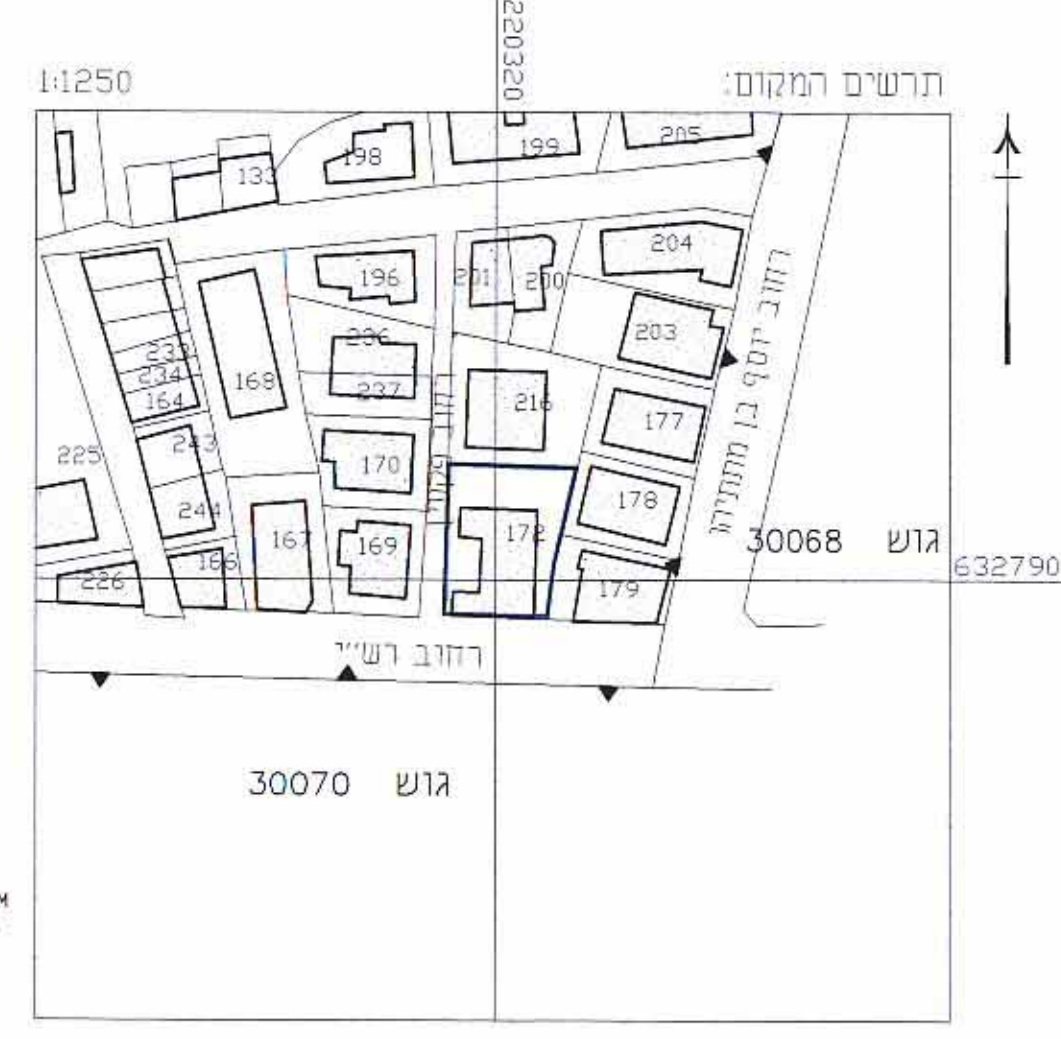
תרשים המקום ק.מ. 1:1250

הערות: 1. הרשת והגבהים משורים כרשת הארצית בנקי טריג מס' 14474, 11448K-11448K.824. הגבהים בהתייחסות לנקודת המ"ד 780.03 מ"י. 827.03 מ"י. 818.723 מ"י. 2. הבהודות נלקחו לפי תוצרי חסי אלרפסה 279/30.