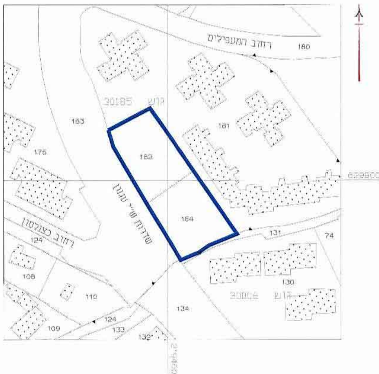
תרשים סביבה קרובה 1:1250