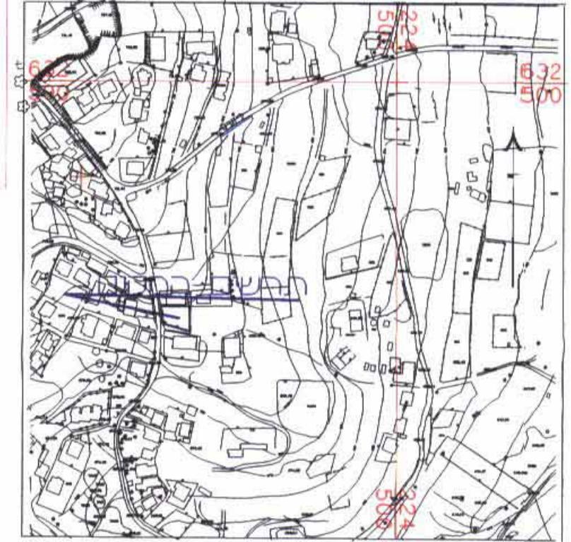
תרשים הסביבה ק"מ 1:5000

מחוז ירושלים מרחב תכנון מסומי ירושלים תכנית מספר 8983 שינוי מס' 02 / לתכנית מס' 3085 (שינוי תכנית מתאר מקומי) 'תכנית מתאר מפורטת' ת ש ר י ט קב. 250 ז