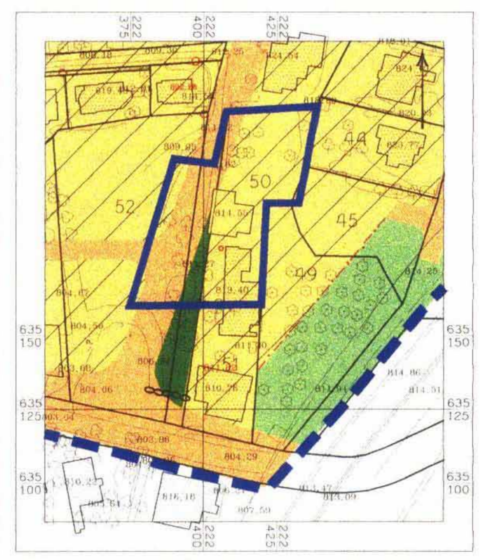
מצב מאושר ע"פ תכנית מס' במ / 3456 א קנה מידה 1:1250

המתכנן : אדר' מחמוד אבו גואם AL SULTAN SUI AIMAN ENGINEERING OFFICE DESIGN SUPERVISION מספר רישון 74623 ת.ד. 80441975 ירושלים / ת.ד. 38164 טל. 050265973 תאריך 5.7.2004