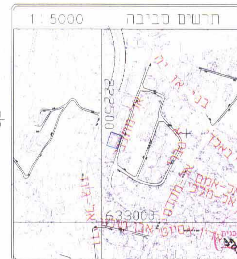
תרחים סביבה 1:5000

המזה אסמק עבד אלטיף בעל הרשעה : סאלח עתמאן עבד אלטיף 02-6273951 - 080208555 - 080237852 - 02-627395470