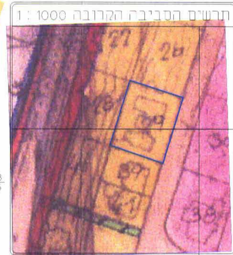
מצב מאושר ע"פ תכנית מס' 2639 קנה מידה - 1:1000