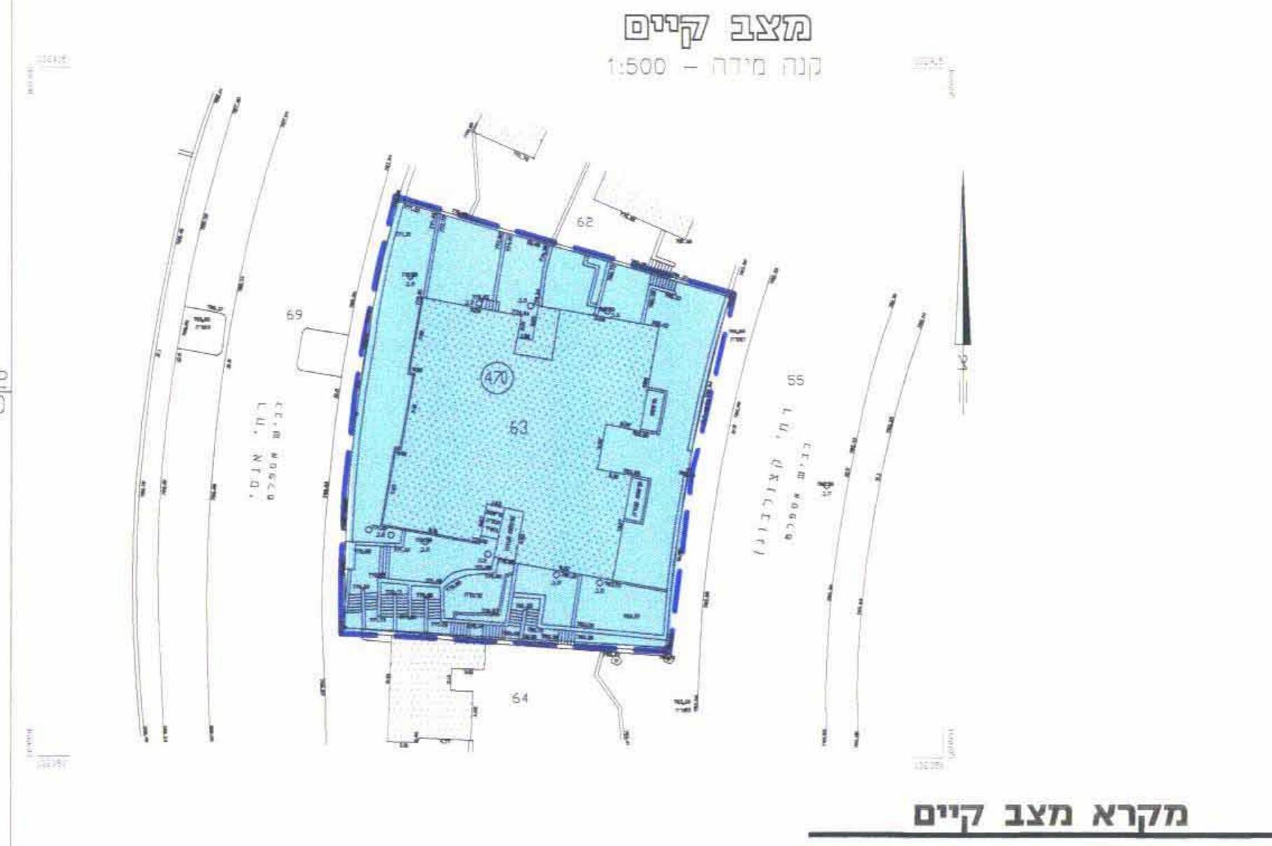
מקרא מצב קיים