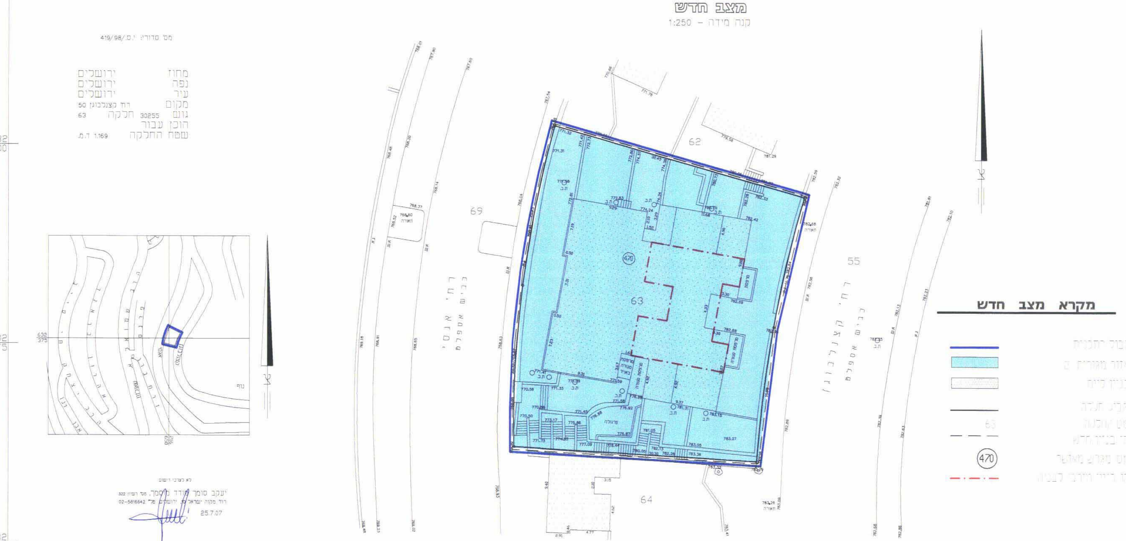
מקרא מצב חדש