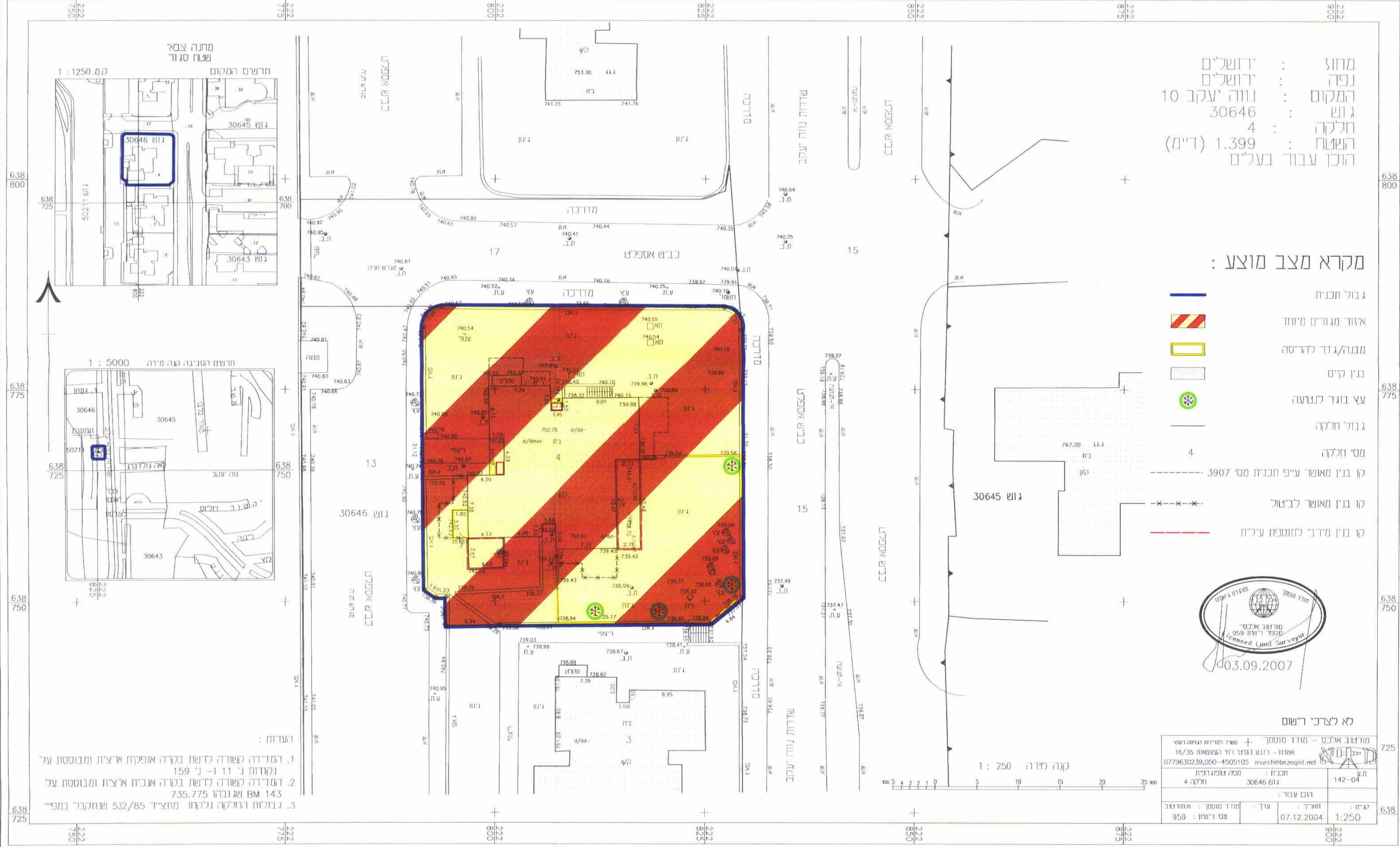
מצב מוצע ק"מ 1:250