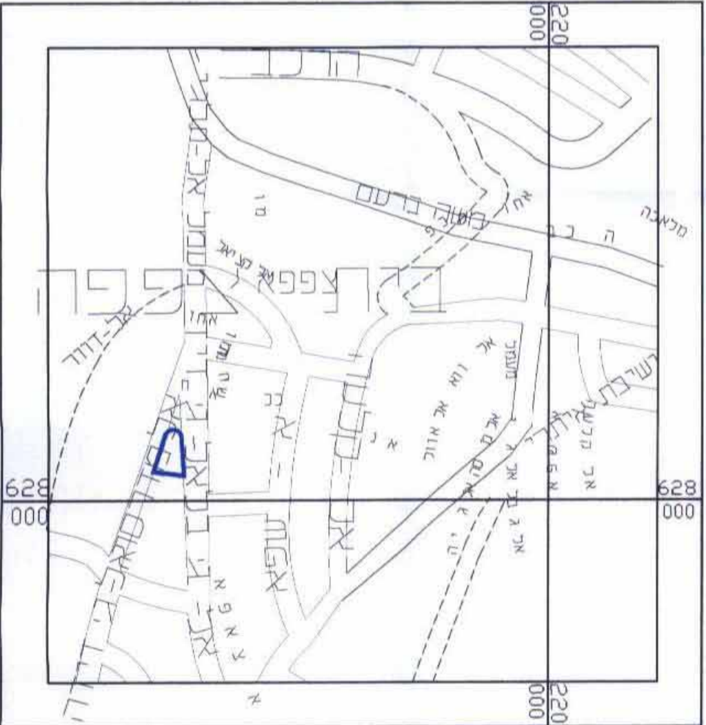
תרשים הסביבה ק 1-5000