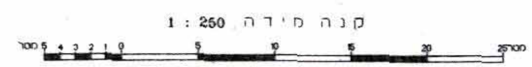
קנה מידה 1:250