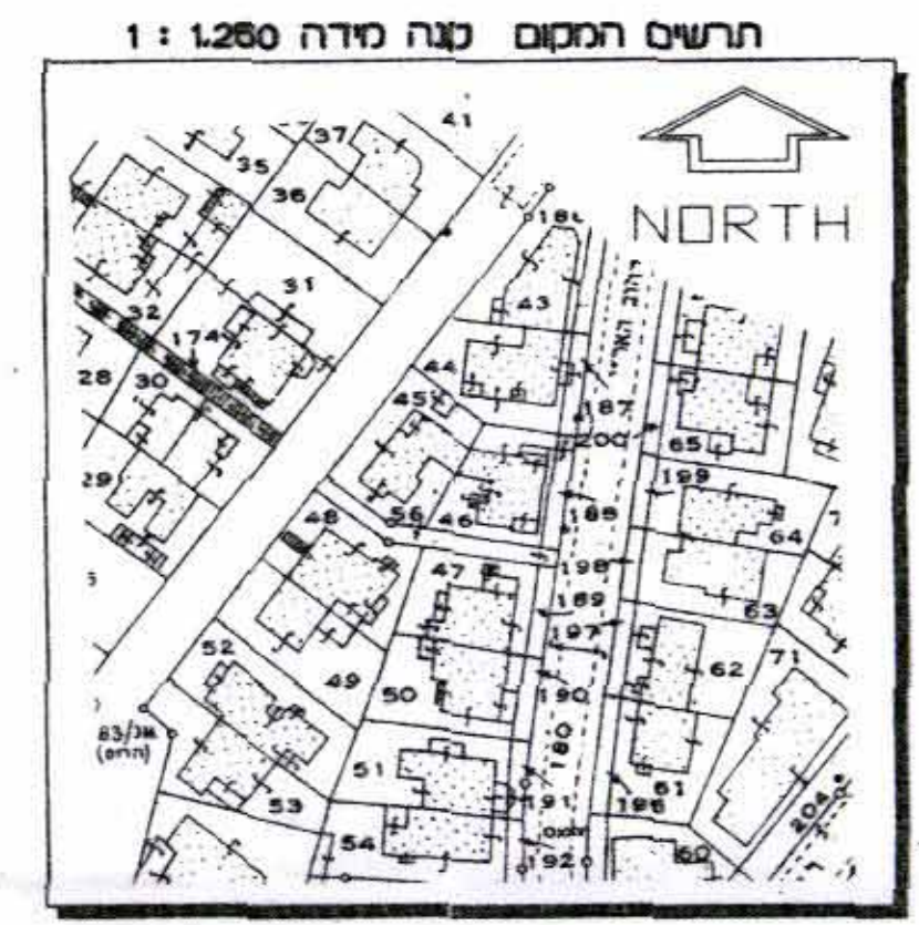
תרשים המקום קנה מידה 1:1260

מחוז : ירושלים נפה : ירושלים המקום : ירושלים, שכ. קרית שמואל גוש : 30023 חלקה : 49 חוק עבור בעלים השטח 0.291 ד.