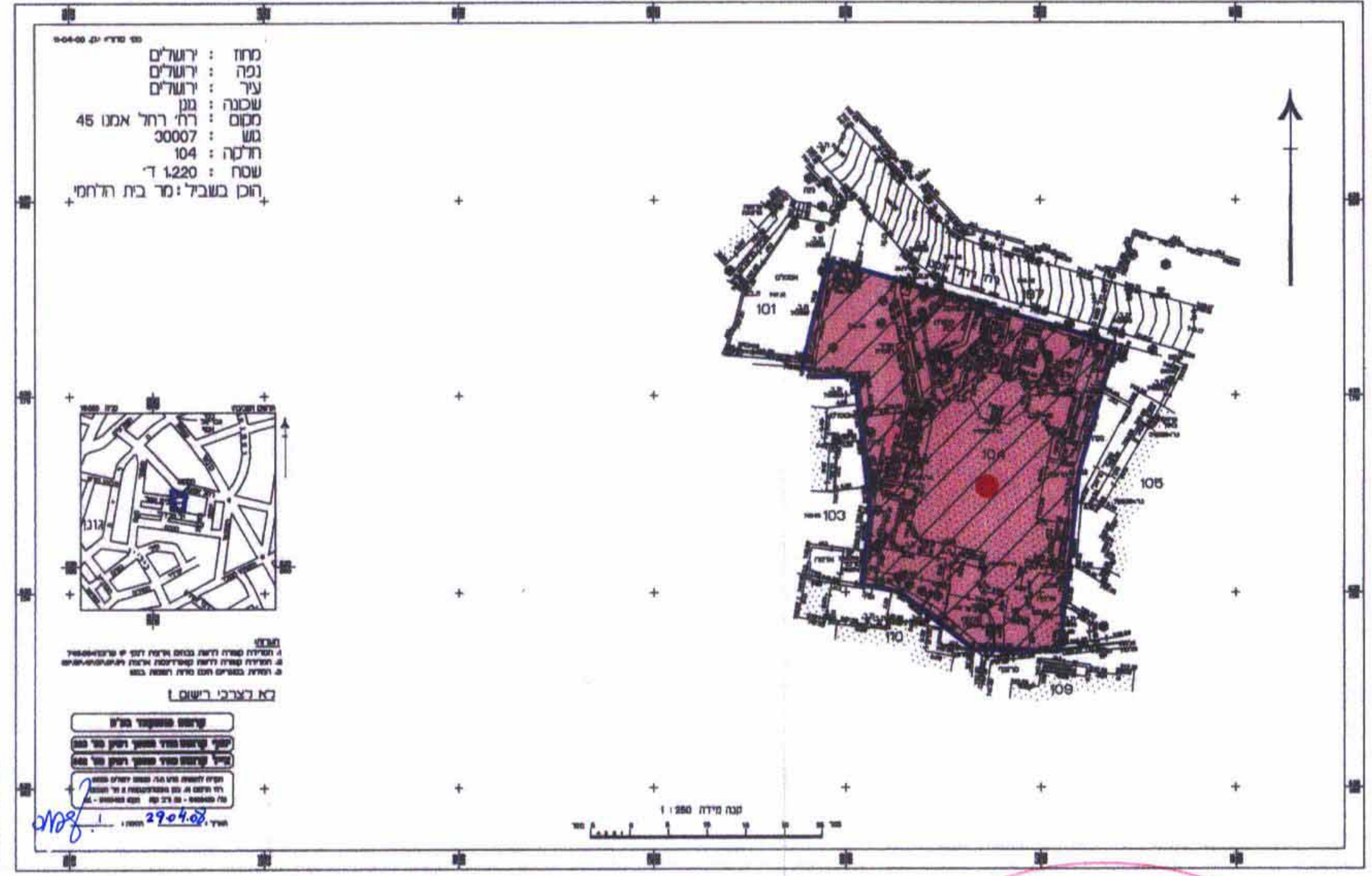
מצב מאושר קנ"מ 1 : 500