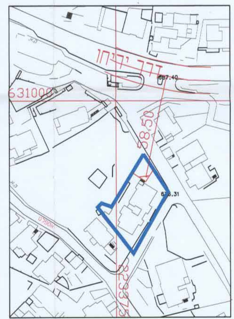
תרשים הסביבה הקרובה קנה מידה 1:1250