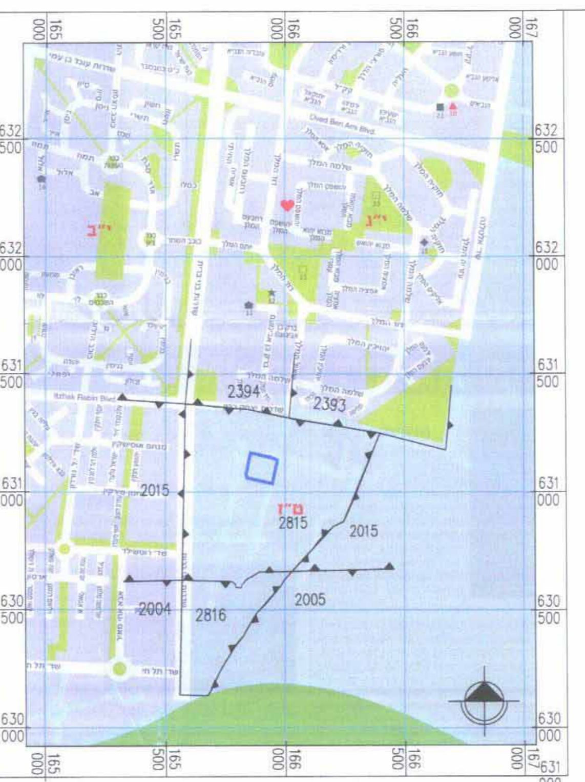
תרשים התמצאות קנ"מ: 1:10000