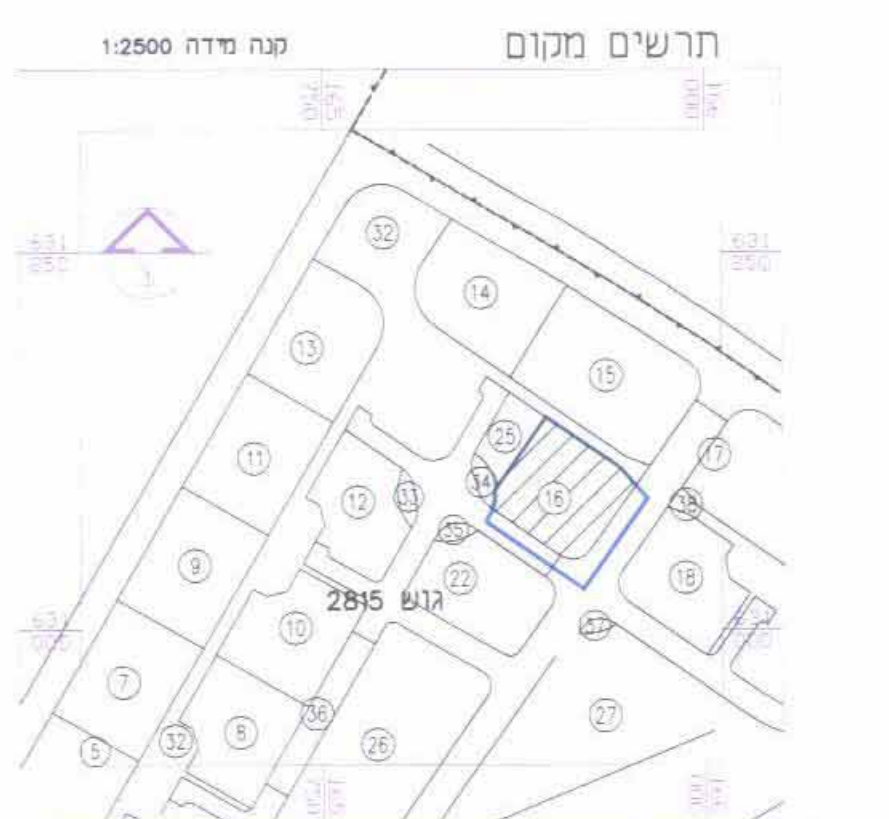
תרשים מקום מנה מידה 1:2500