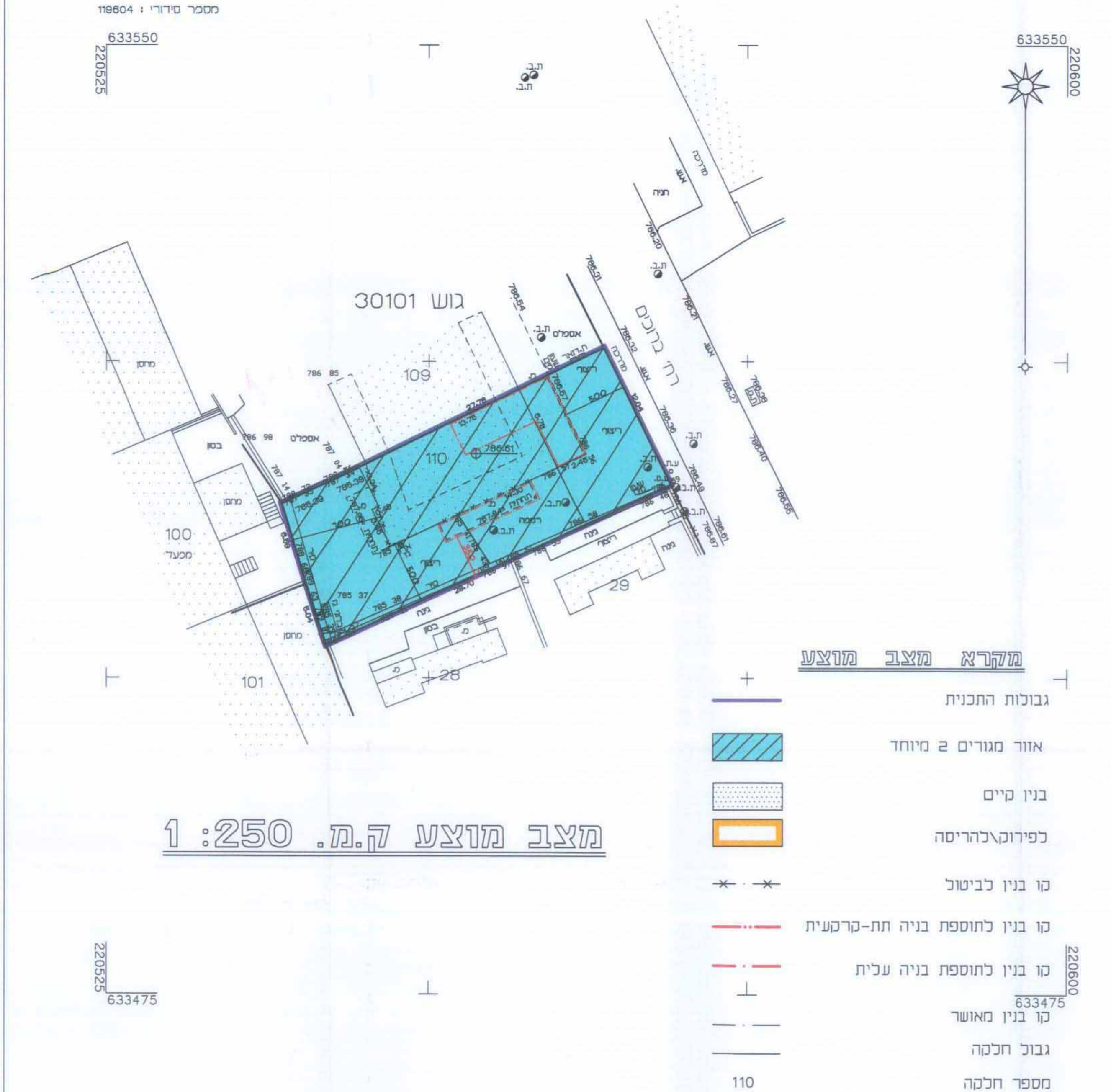
מצב מוצע ק.מ. 1:250

אשר מקח אני מאשר כי מסח' זו היא העתק נכון של מסמך שוכנעתי על סמך מידתה שהתחייבתי כיום 21 בחודש 11 שנת 2024. י-ם טל' 5866563-02 תא. 7987878787 המסמך בוצע בהתאם להמלצת המודים ומשרד התכנון והבנייה-1998 28.11.24 אדסטר ראובן-כנפי עזרים 88 י-ם שם המודד ומעג מספר רישוי תכנית תאריך