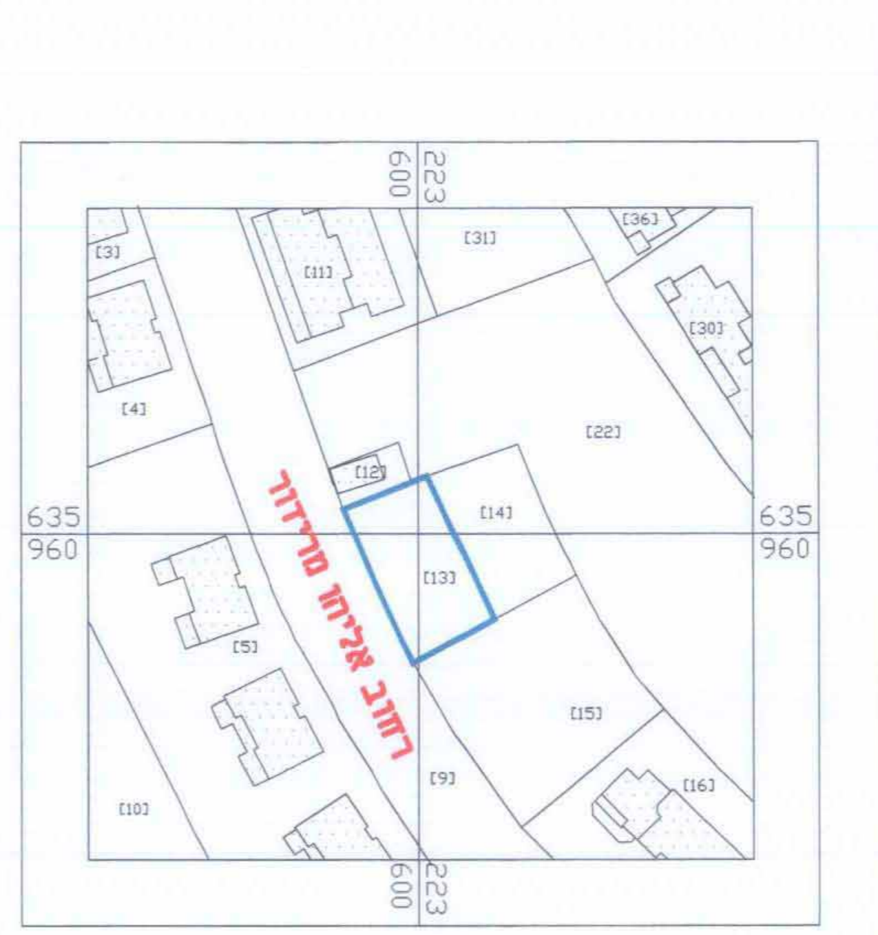
תרשים המקום קנ"מ 1:1250