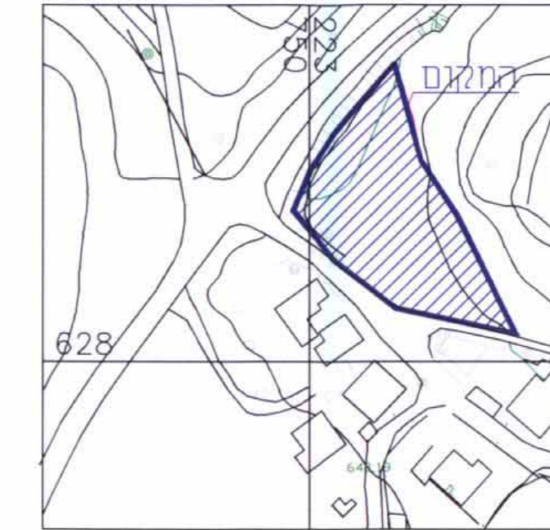
תרשים המקום קנה מידה 1:1250