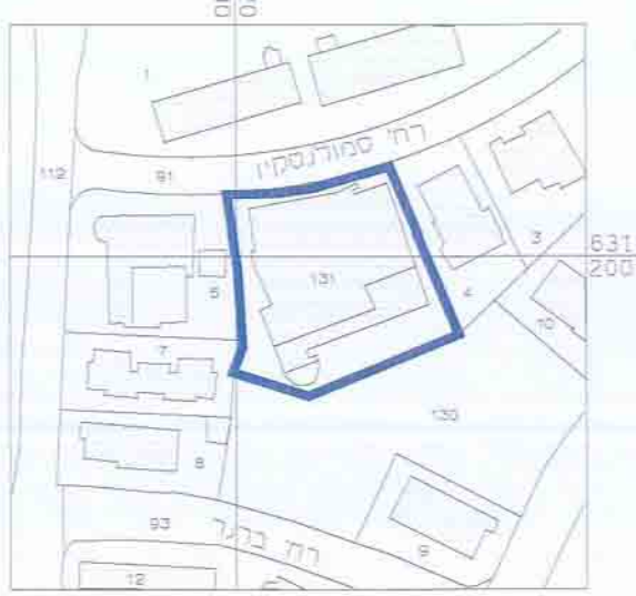
תרשים מקום קנ"מ 1:1250