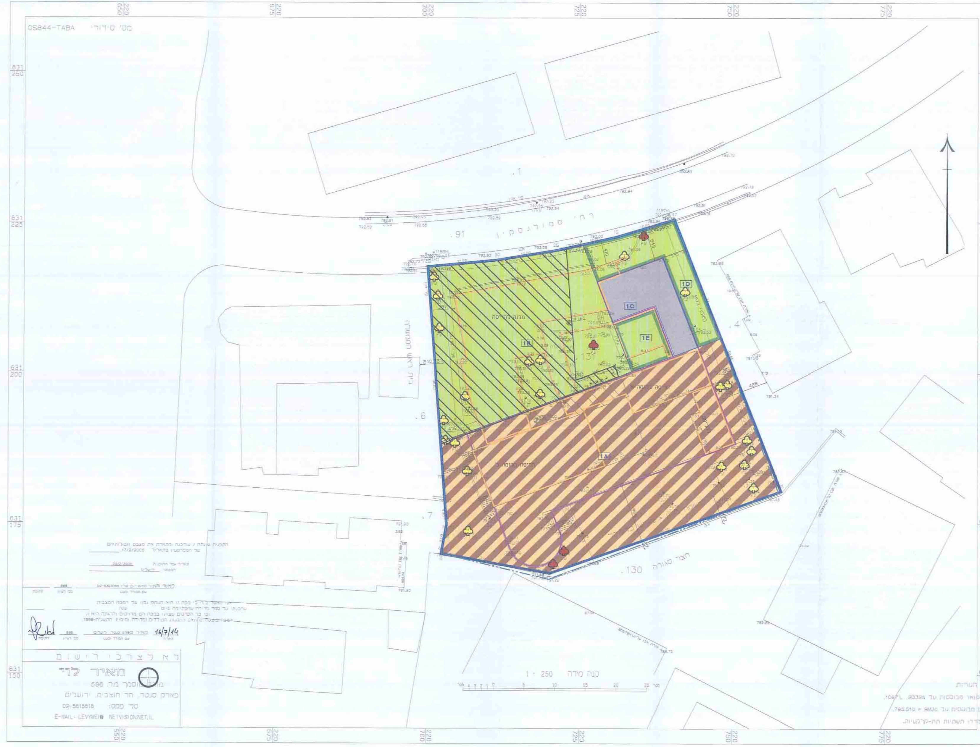
מצב מוצע קנ"מ 1:1250