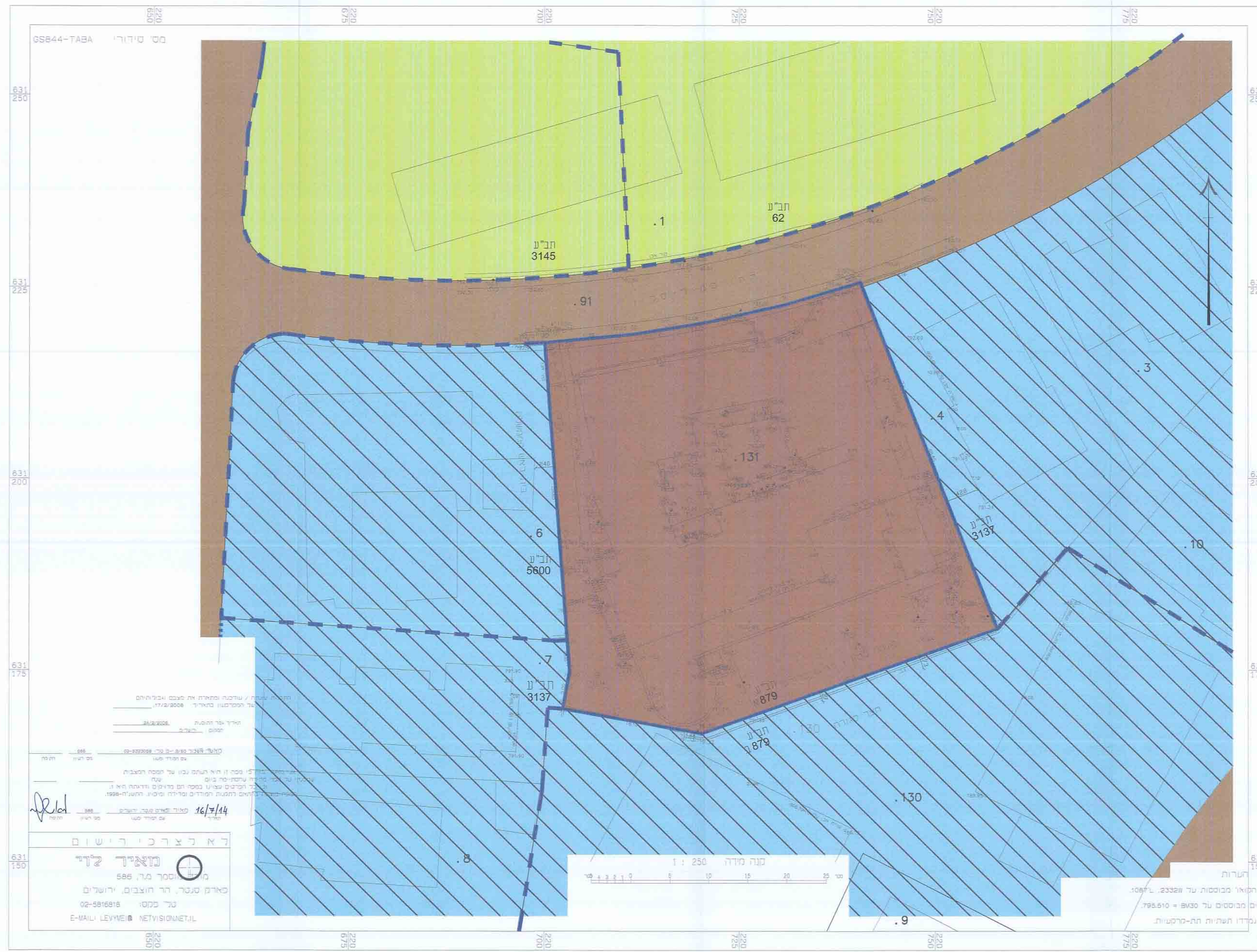
מצב מאושר קנ"מ 1:1250