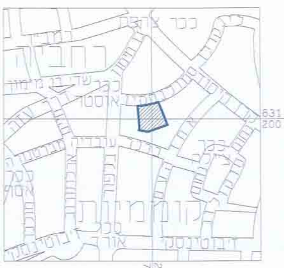
תרשים סביבה קנ"מ 1:5000