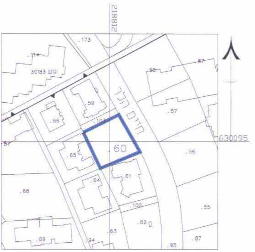
תרשים סביבה קרובה קנה מידה 1:2500