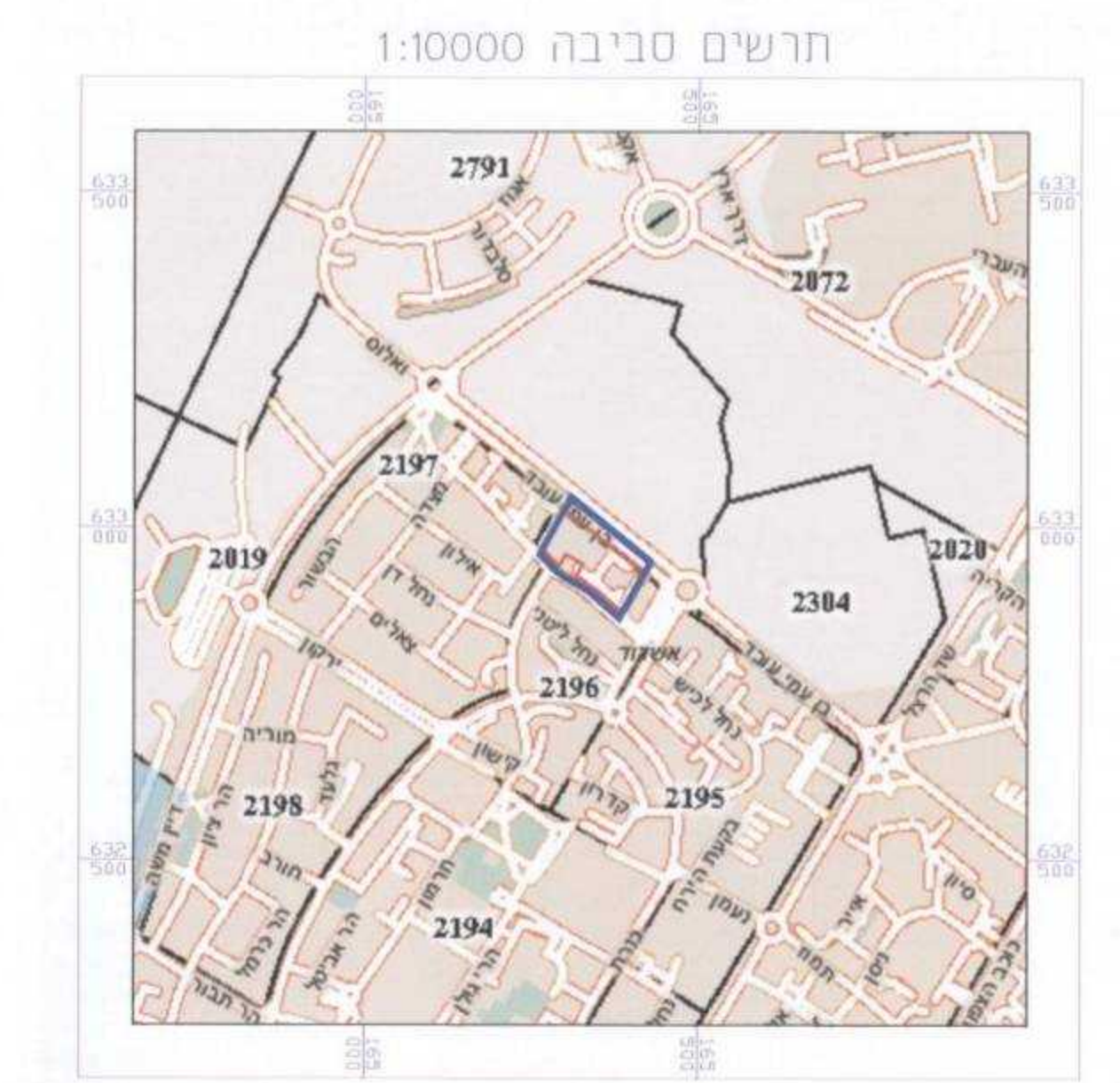
תרשים סביבה 1:10000