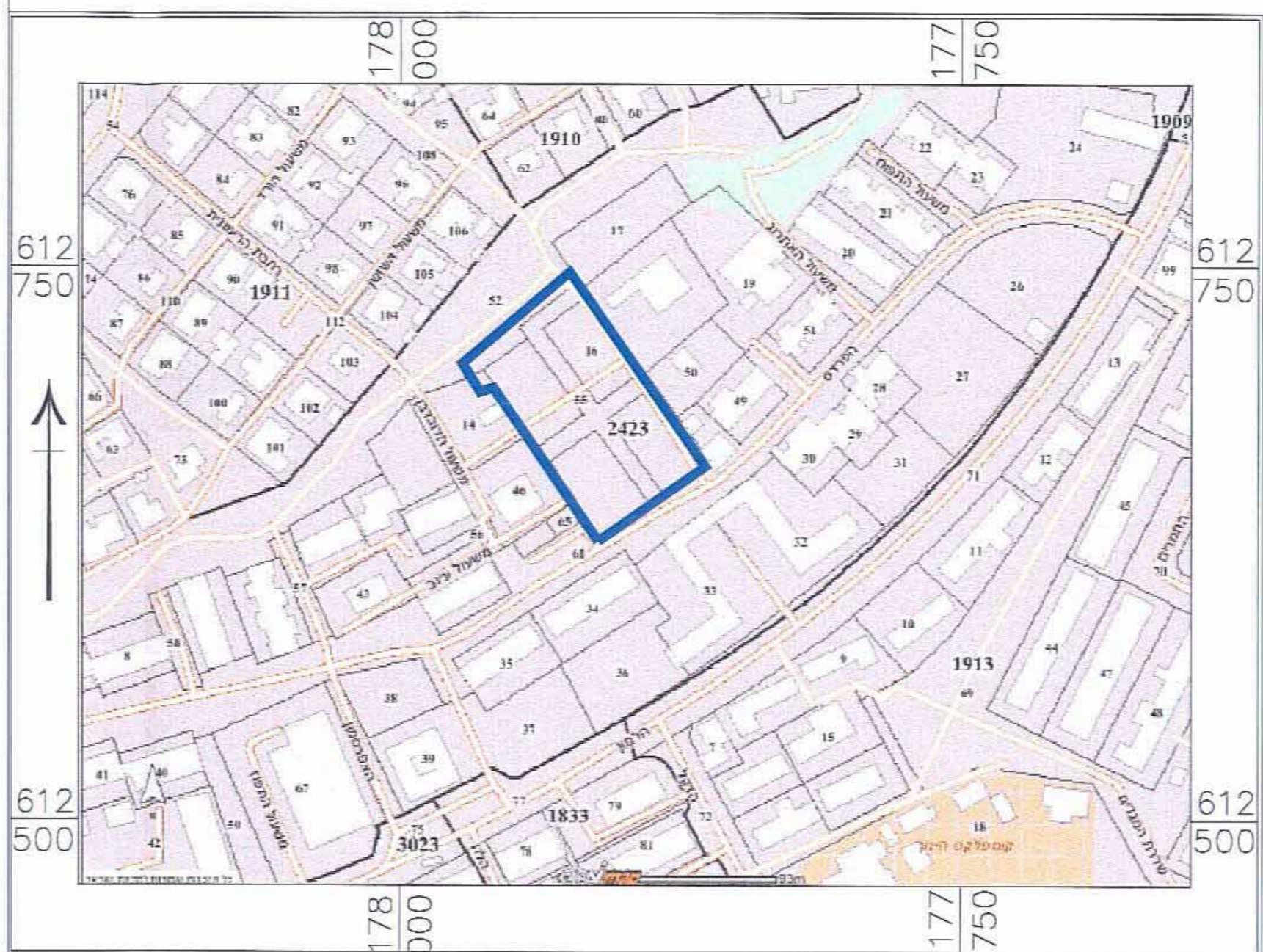
תרשים סביבה - על קרע תוכנית 5/106/02/9 ק"מ 1:2500