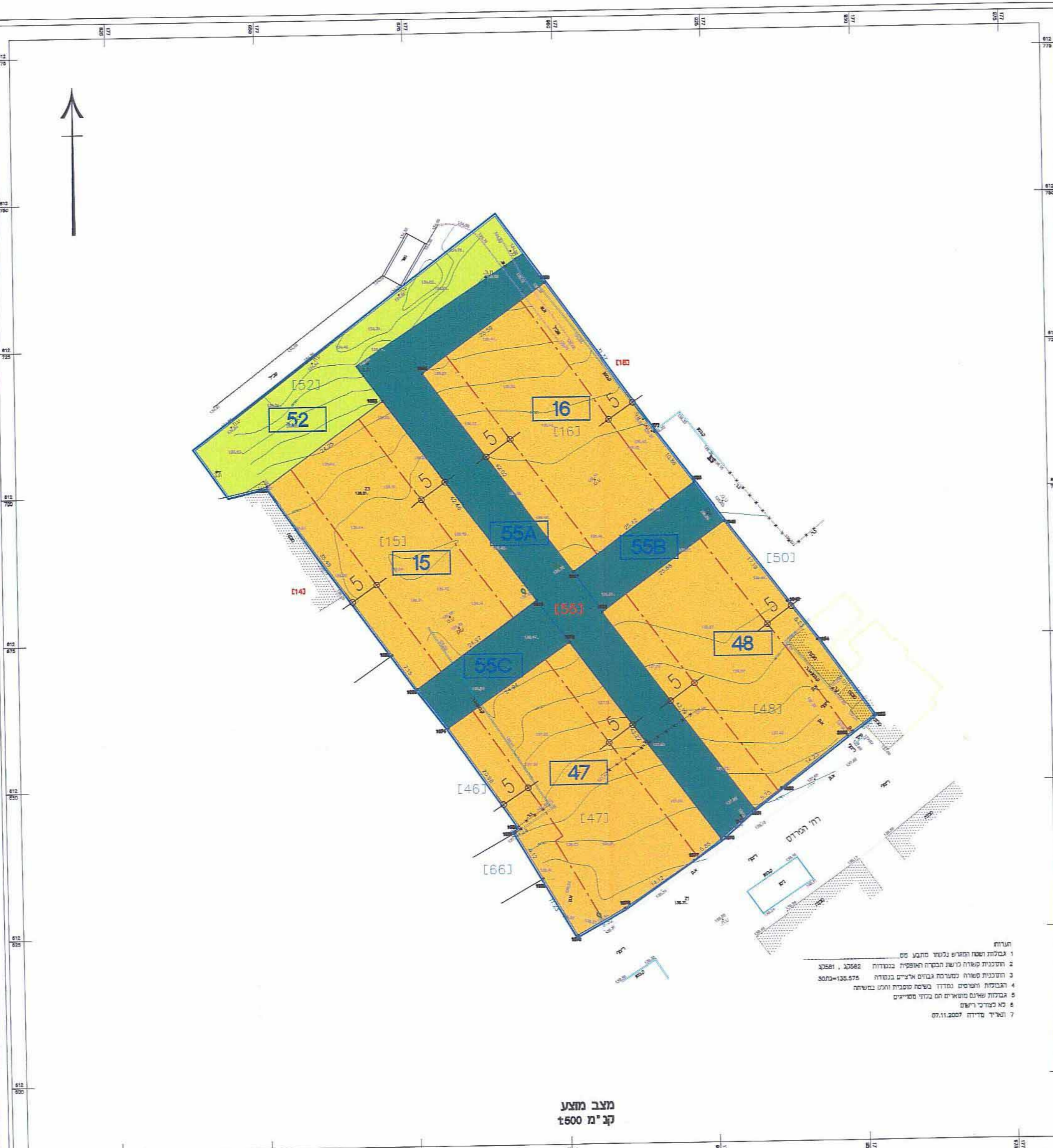
מציב מאשר ק"מ 1:500