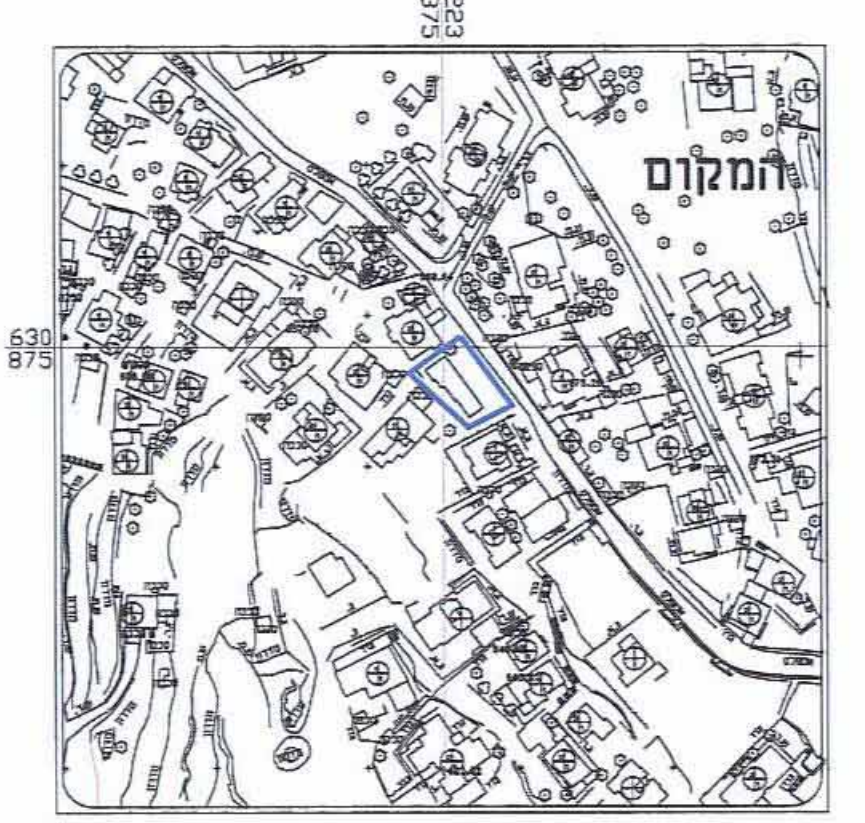
תרשים סביבה קרובה קנה מידה 1 : 1250