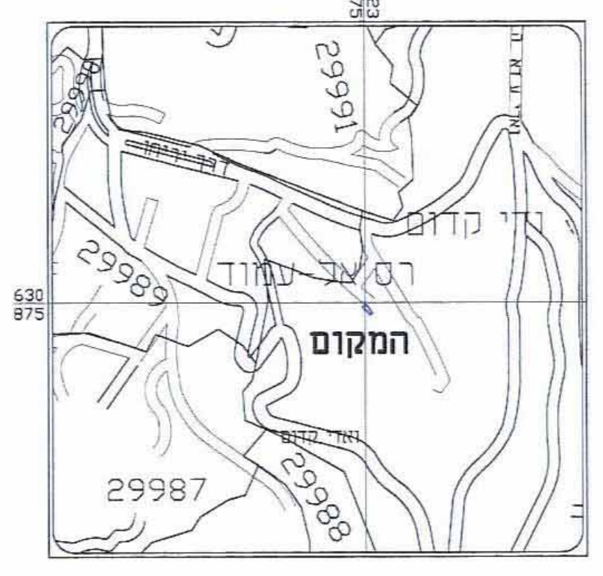
תרשים התמצאות כללית קנה מידה 1 : 5000