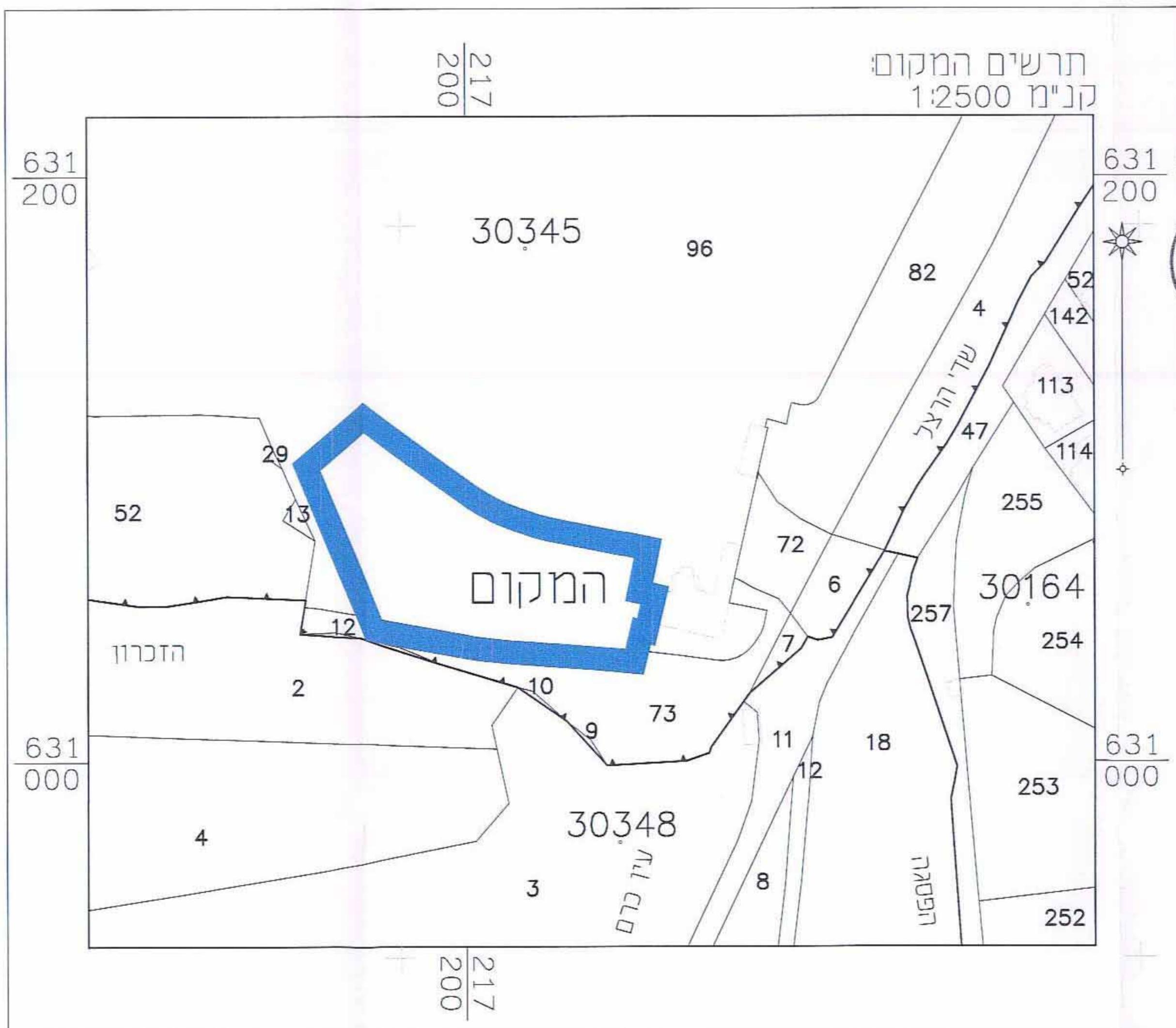
תרשים המקום קנ"מ 1:1250