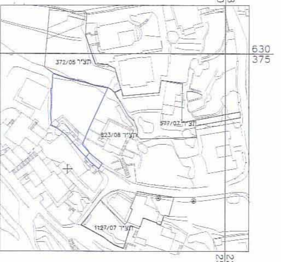
תרשים סביבה קרובה קנה מידה 1:250