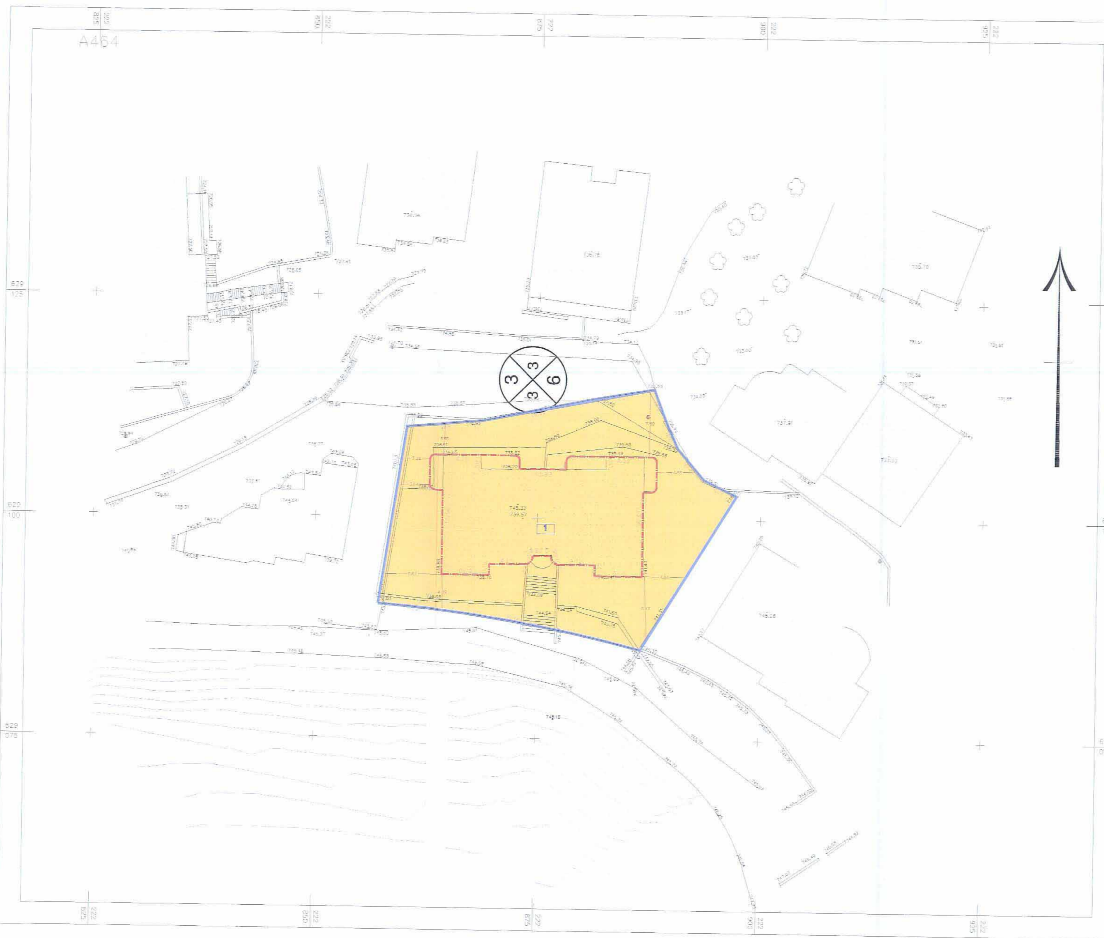
מצב מוצע קני"מ 1:250