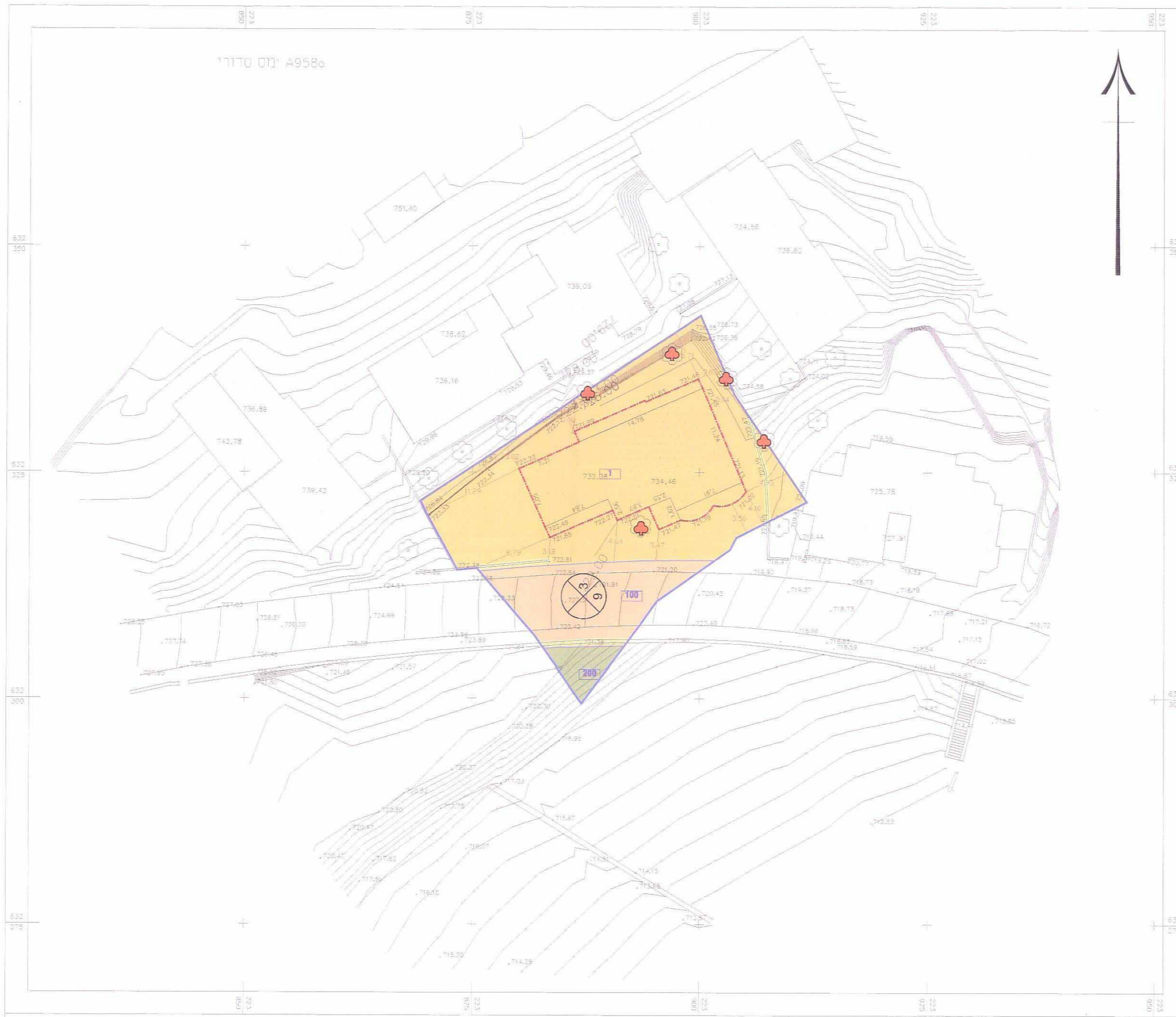
מצב מוצע 1:250