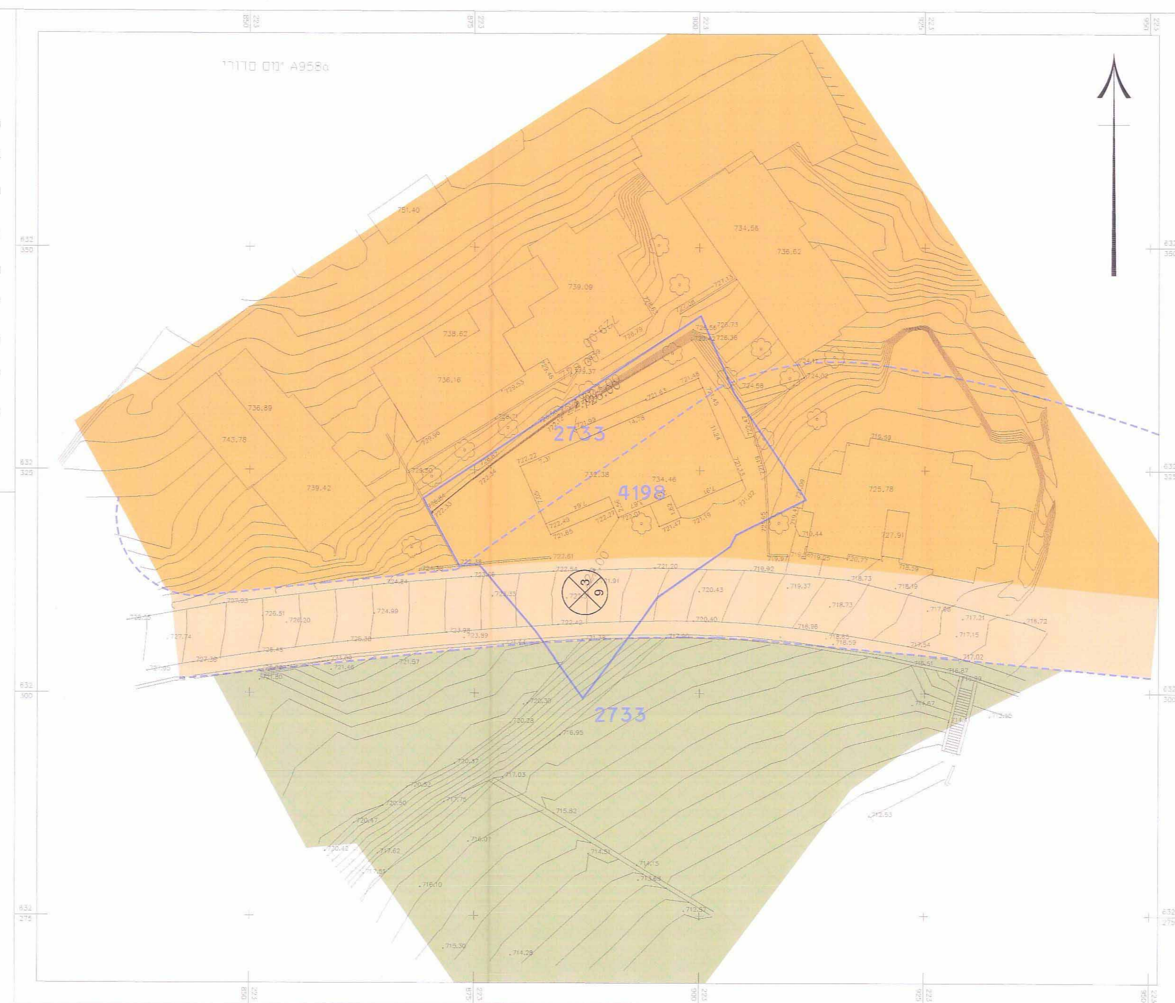
מצב מאושר 1:250