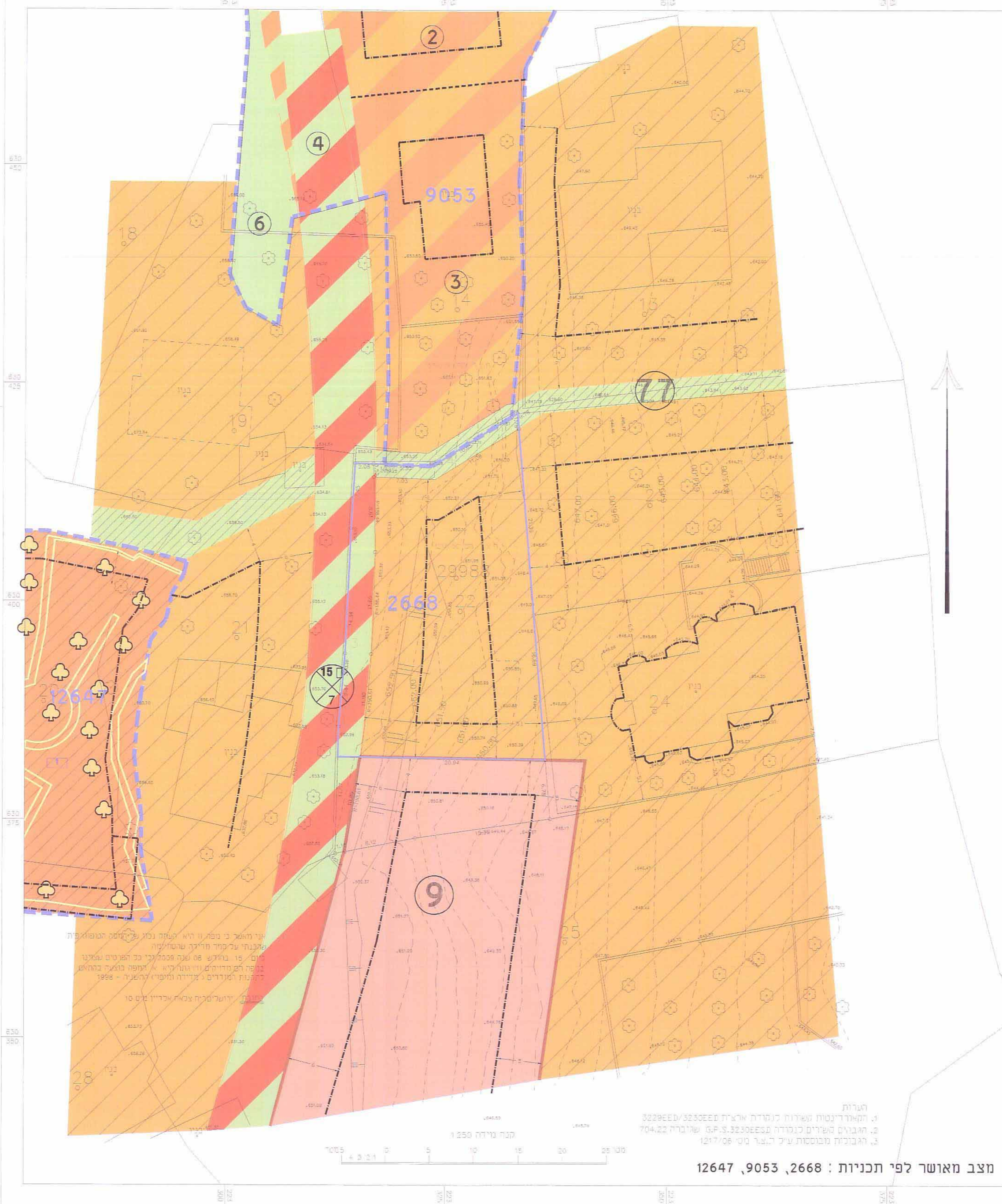
מצב מאושר לפי תכנית: 2668, 9053, 12647