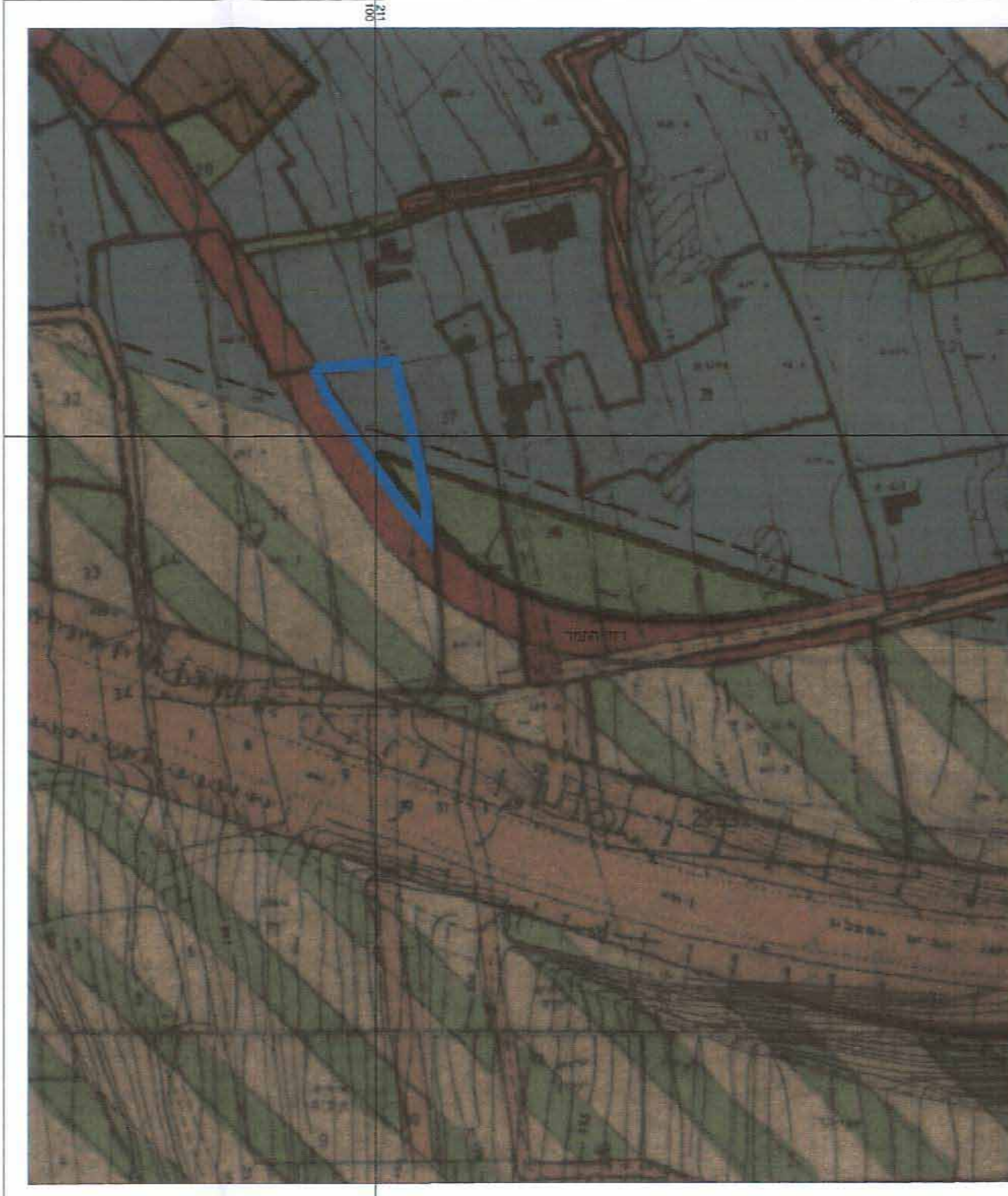
תרשים הסביבה ת. מתאר ימ"ב/מ"ו/א ק.מ. 1:1000