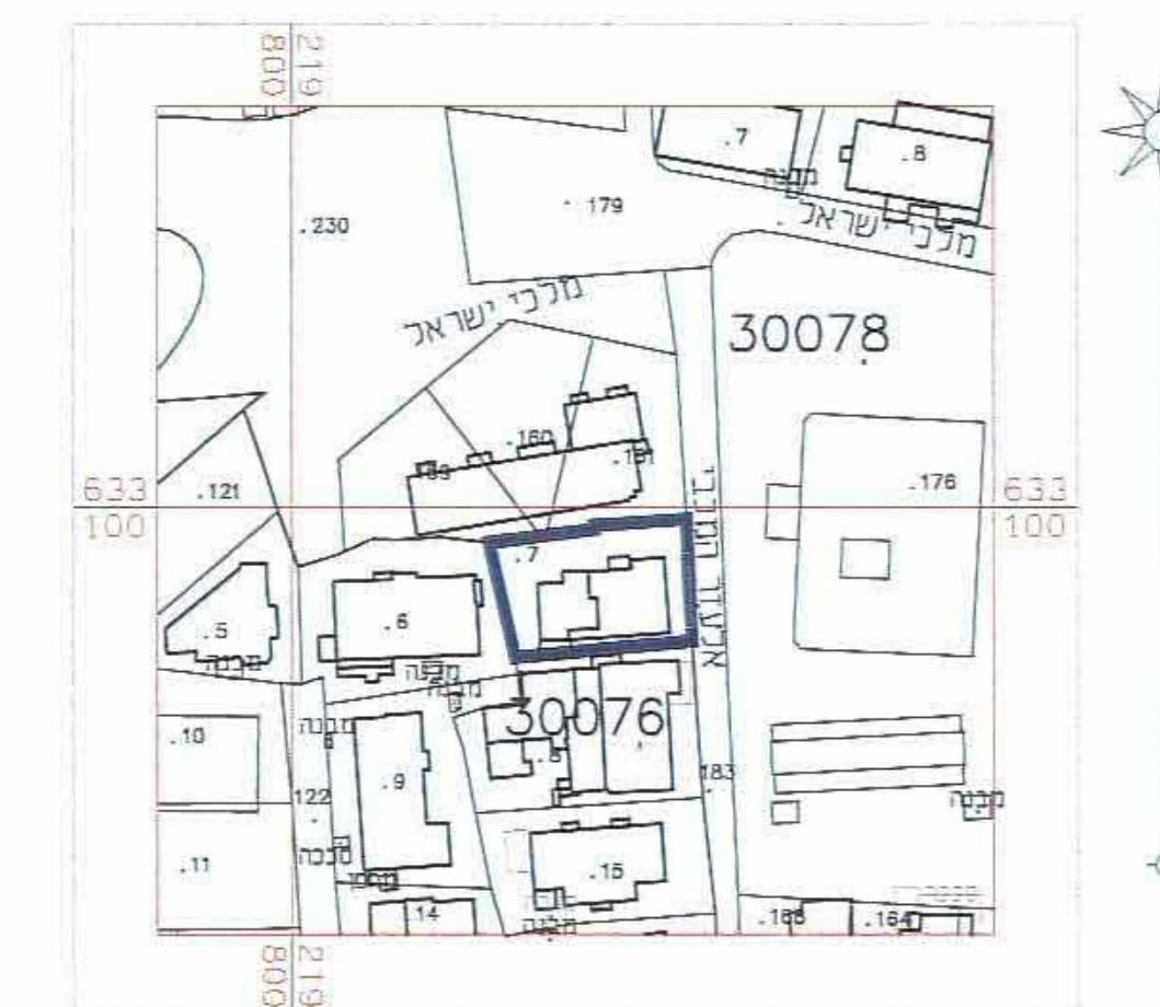
תרשים סביבה קרובה קנ"מ 1 : 250