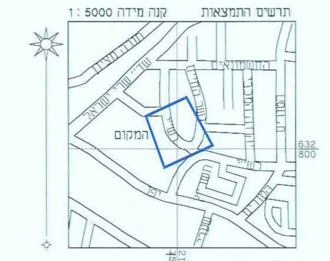
תרשים סביבה קנה מידה 1:5,000