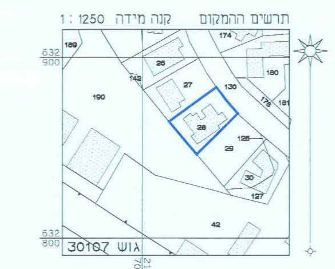
תרשים המקום קנה מידה 1:1250