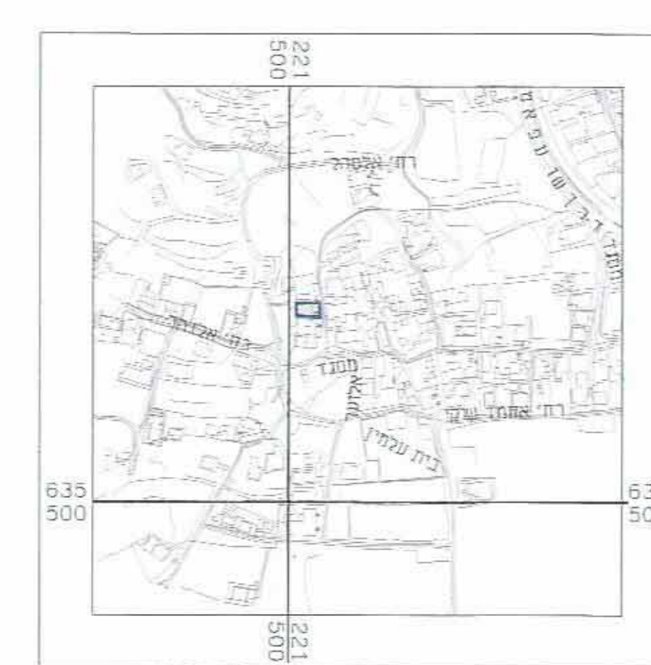
תרשים התמצאות כללית קנ"מ 1:5000