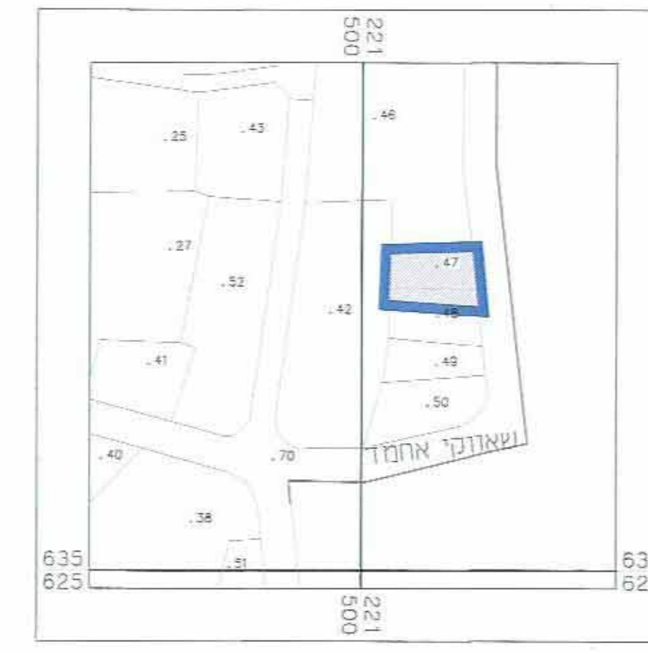
תרשים טביבה קרובה קנ"מ 1:1250