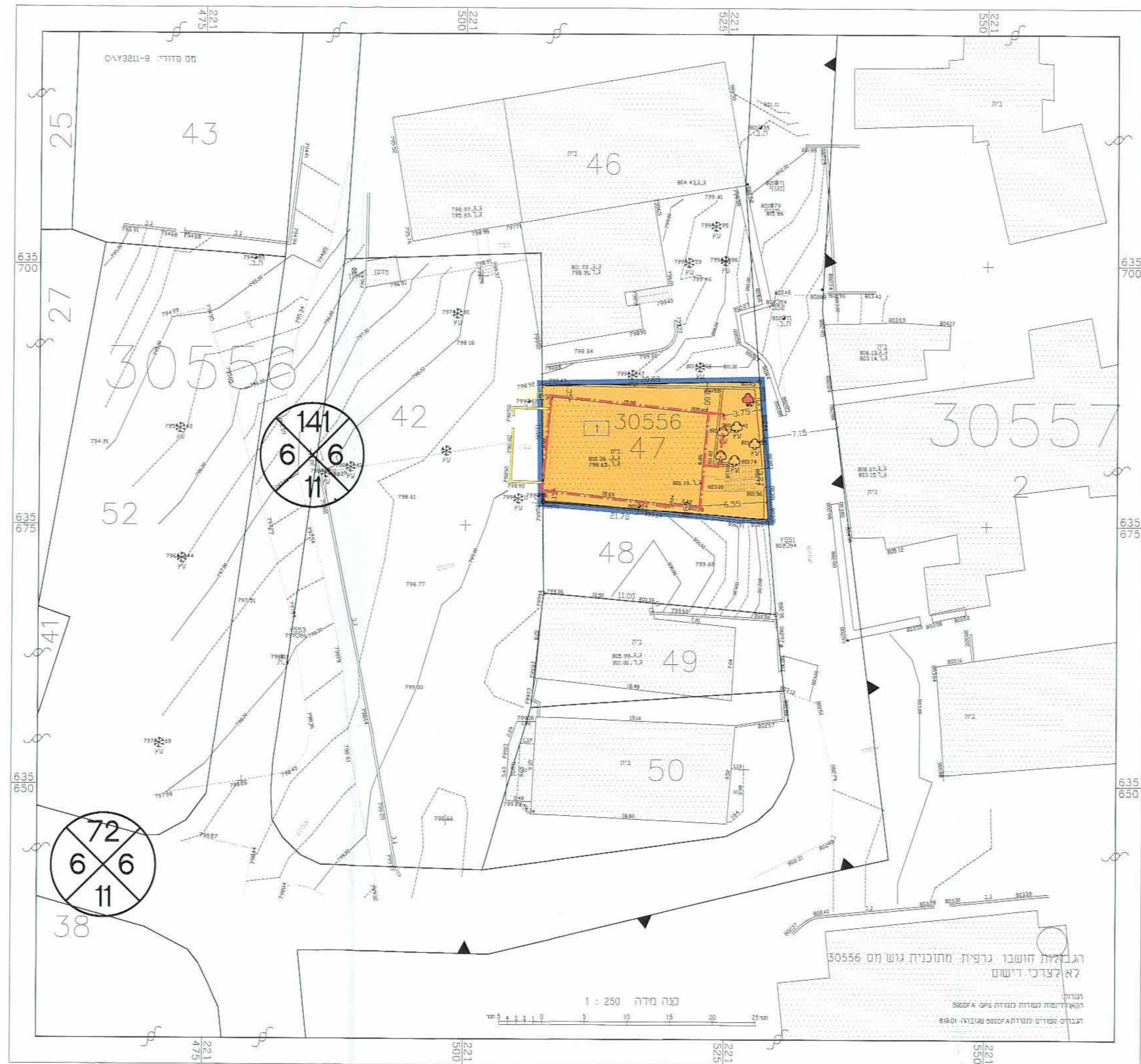
מצב מוצב קנ"מ 1:250