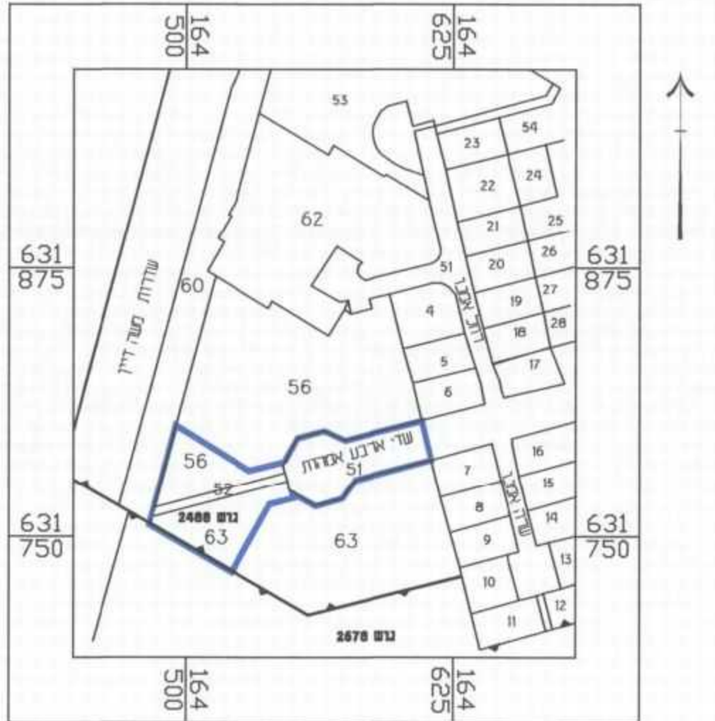
תרשים סביבה: ק.מ. 1:2500