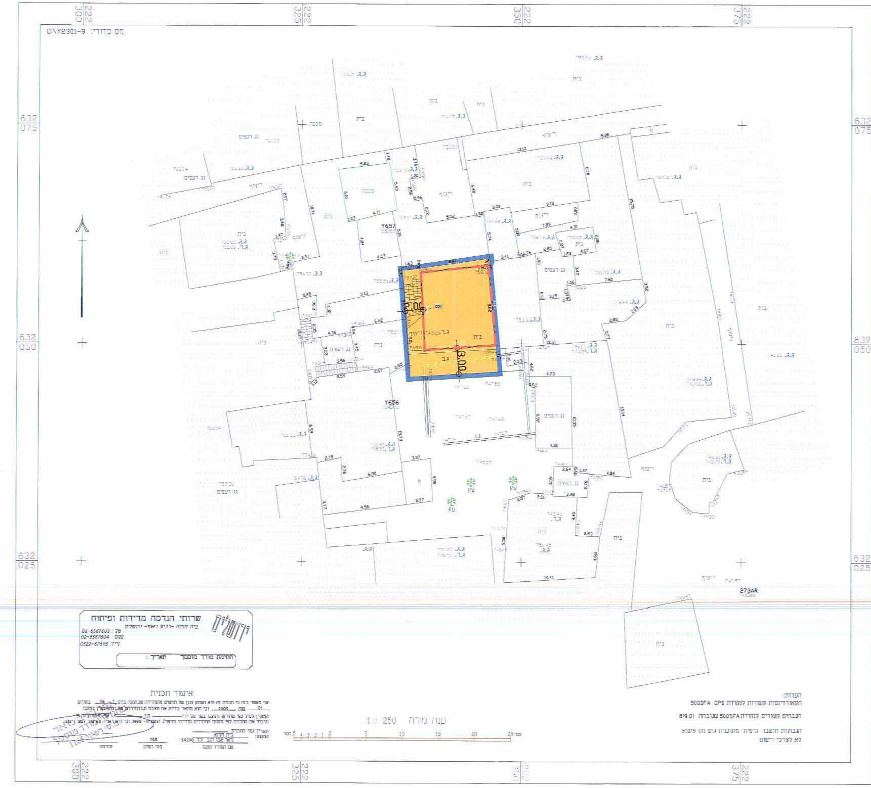
מצב מוצע ק.ה. 1:250

אישר התכנית אר טאר בנין כי תכנית זו היא תכנית מס' 10816 והיא תכנית התשובה מס' 1995. מספר ת"מ: 1168