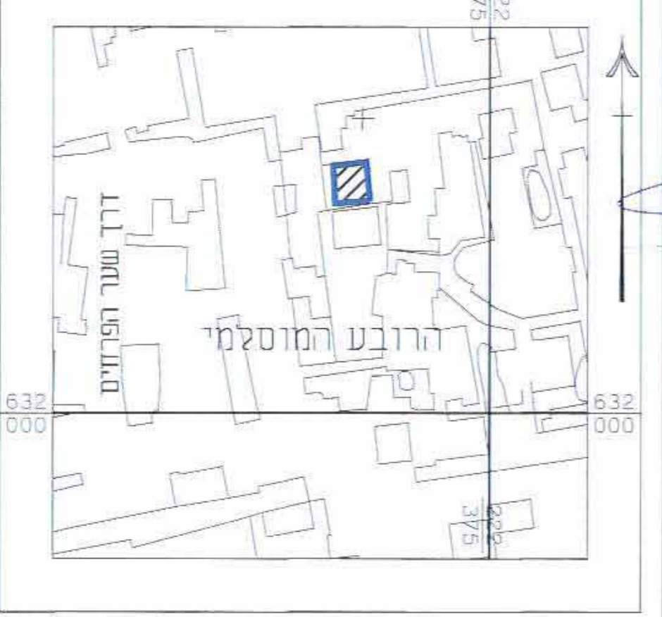
תרשים מקום קנה"מ 1:1250