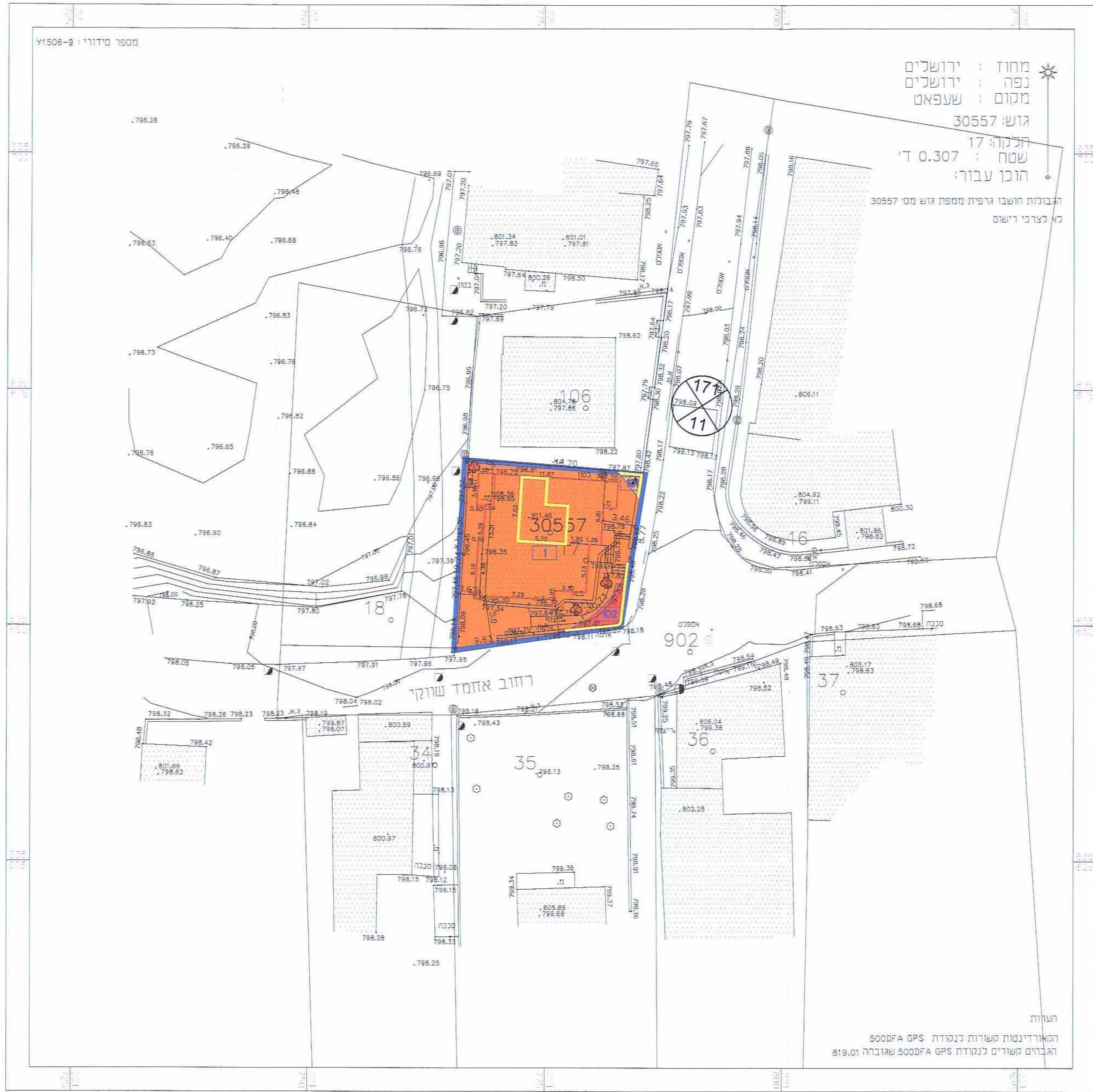
מצב מוצע קנ"מ 1 : 250