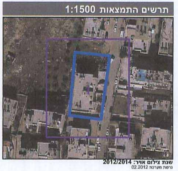
שנת צילום אוויר: 2012/2014 גרסת מערכת: 02.2012

* כמפורט בהוראות / הודעה תרשים התמצאות 1:1500