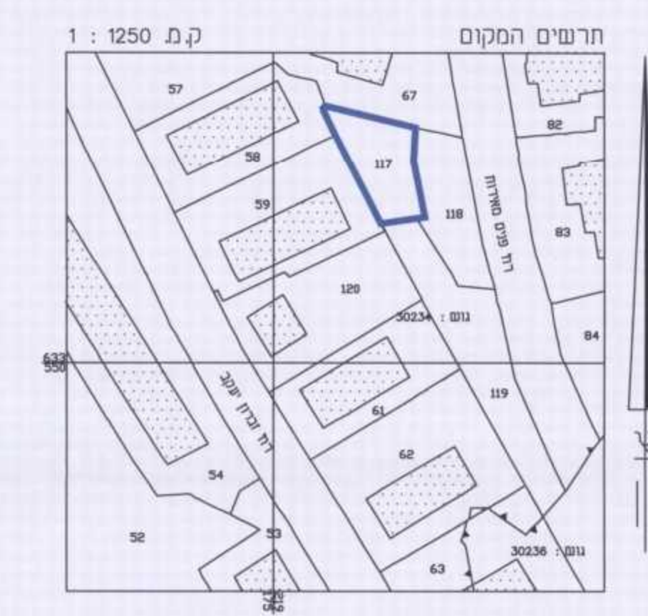
תרשים סביבה קרובה קנ"מ 1:1250