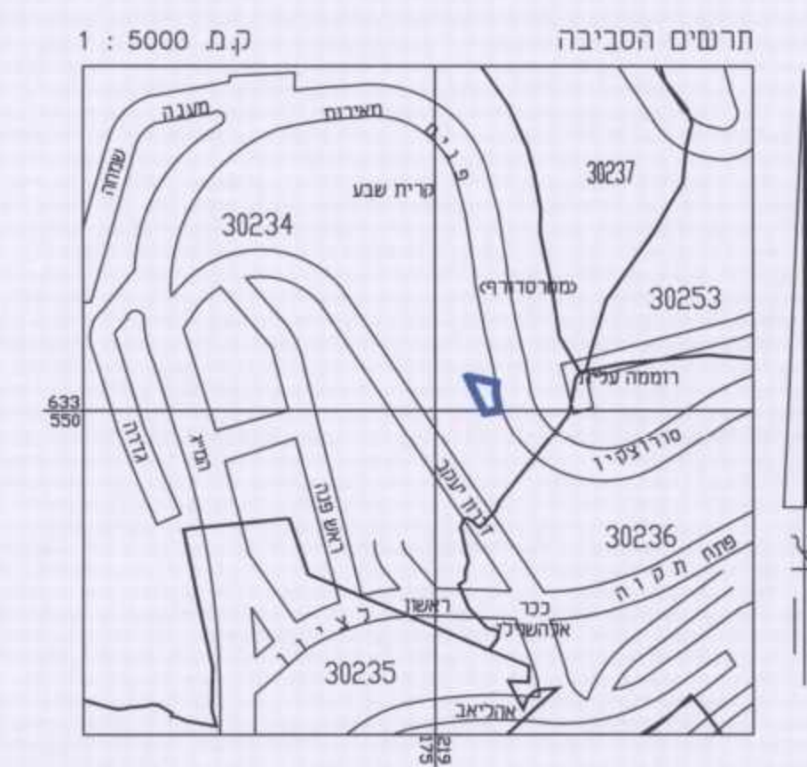
תרשים התמצאות כללית קנ"מ 1:5000