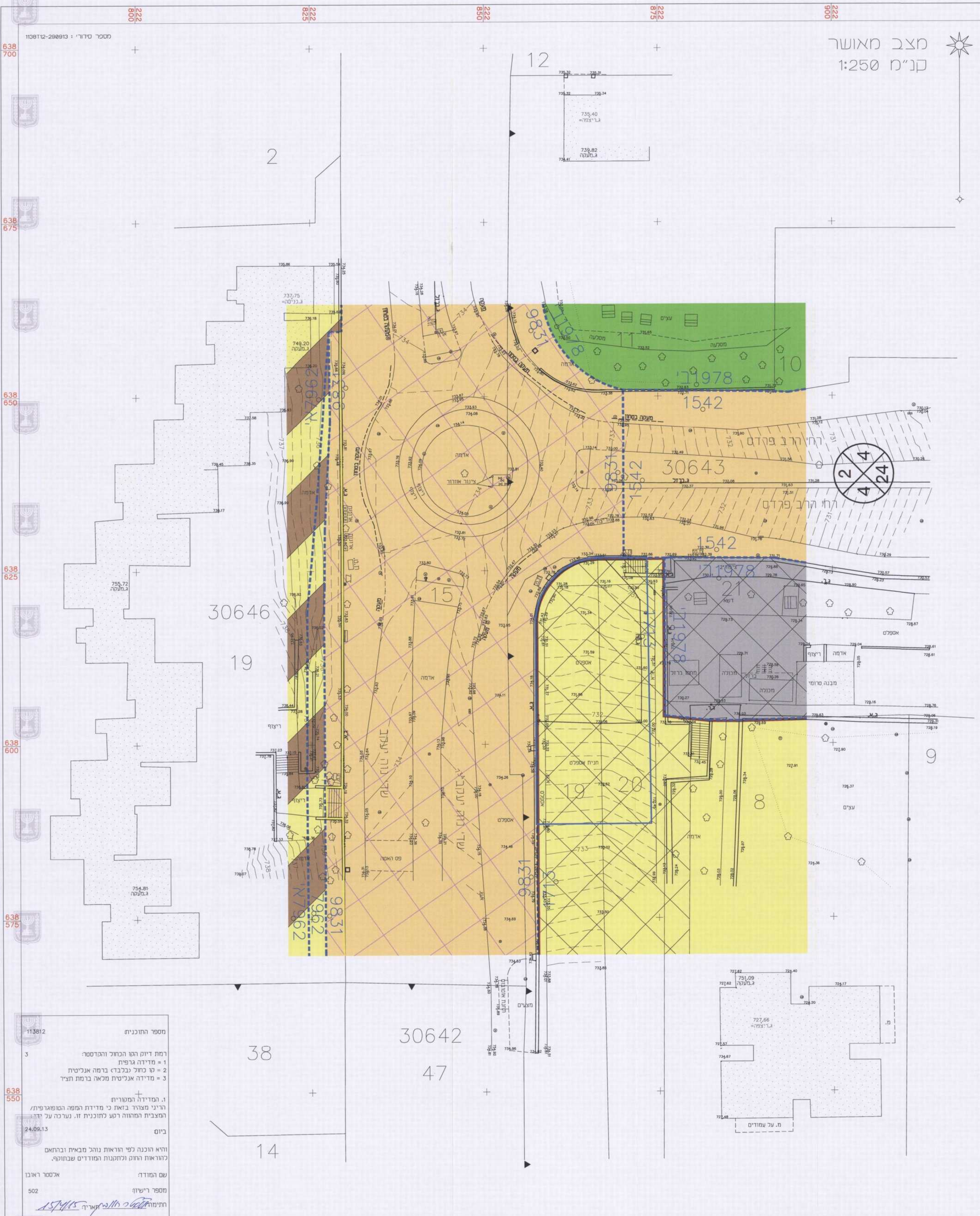
מצב מאושר קנ"מ 1:250

מספר התוכנית 113812 3 רמת דיוק רגול הכוול והקדסט: 1 = מדידה גרפית 2 = סו כוול נכבדד בומה אנכית 3 = מדידה אנכית מלמא ברמת תער 1. המדידה המסויימת 2. רויני מצויר בזאת כי מדידת המפר והופוגרפית/ המצבית המהווה רקע לתוכנית זו. נערכה על ידי 24.02.13 3. ביום ולא הוכנה לפי הוראות נוהל מבית וברחאם לבראות הרשם ולחוקות המודרים שבתוקף. שם המודד: אלסטר ראובן מספר רישום: 502 חתימת המודד: [Signature]