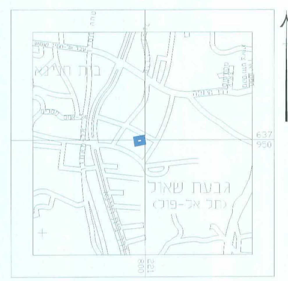
חידוש התמצאות כללית 1:10000