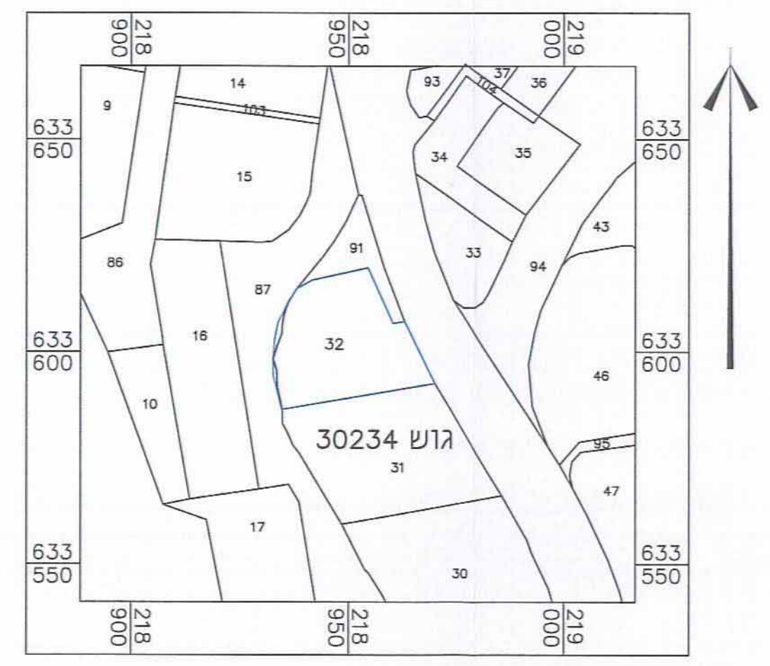
תרשים סביבה קרובה קני"מ 1:1,250