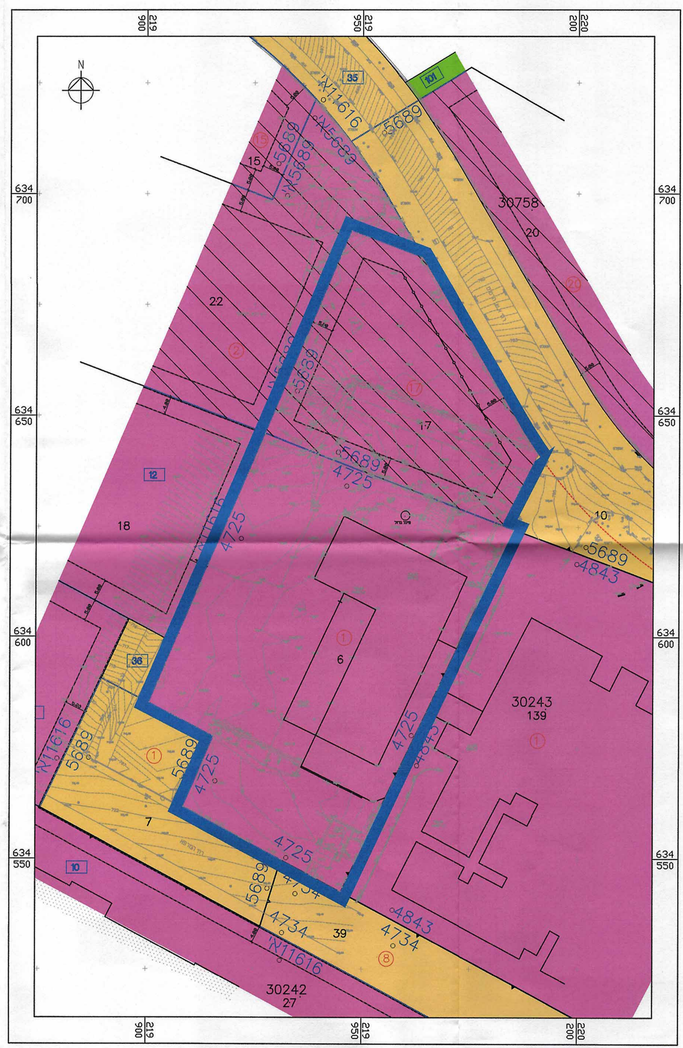
חרישים המקום קני"מ 1:2500